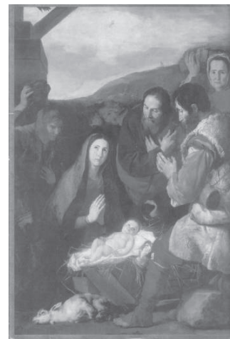
A pásztorok hódolata,

családapai szerepe és békét akaró tevékenysége manapság is példaképpül szolgál számunkra. Várjuk a többi szentéletű magyarnak oltára emelését, Mindszenty hercegprímással a többi püspök, és az egyszerű népből fakadó fiatalok elisme-