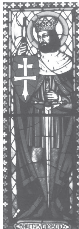
Szent László üveglak, Canada, Calgary, Szent Erzsébet templom, 20. sz. eleje

dás. Kiváló uralkodói képességével, vitézségével, de még inkább életszentségével kivette a magyarságot a belső viszálykodások és az erkölcsi süllyedés örvényéből, a külső támadások pusztulás fenyegető veszélyéből. Ezért méltán tekintjük őt az ország második megszerzőjének.