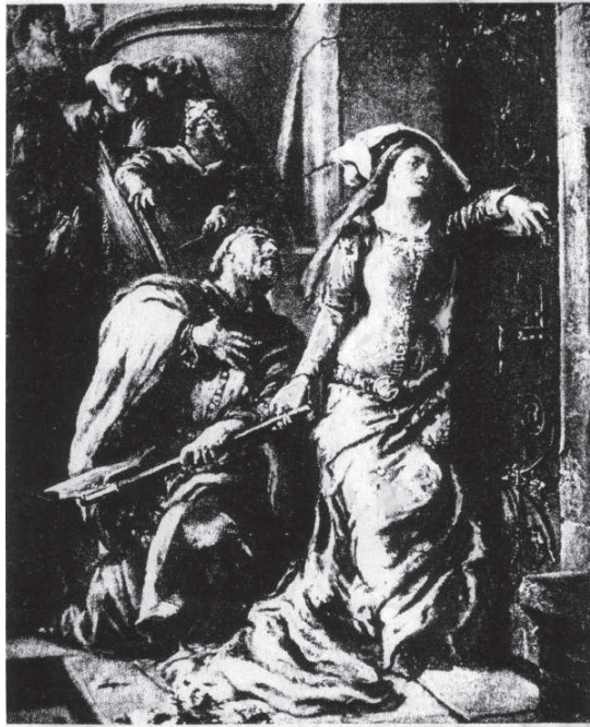
Jan Matejko (1838-1893) híres történelmi festménye

Az összesereglett vendégek közül, akik a történelmi esküvőn jelen voltak, ketten feltűnően hiányoztak: a menyasszony egy évvel idősebb testvére, Mária magyar királynő , valamint anyjuk, az özvegy magyar és lengyel királynő . Körülöt-