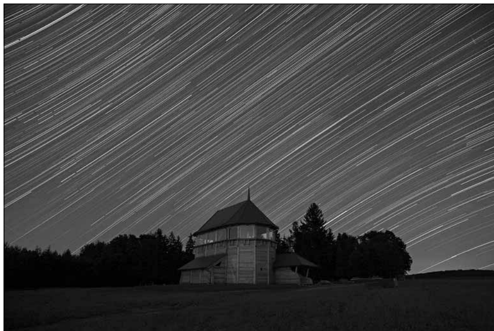
CSILLAGJÁRÁS MAGYARFÖLDÖN