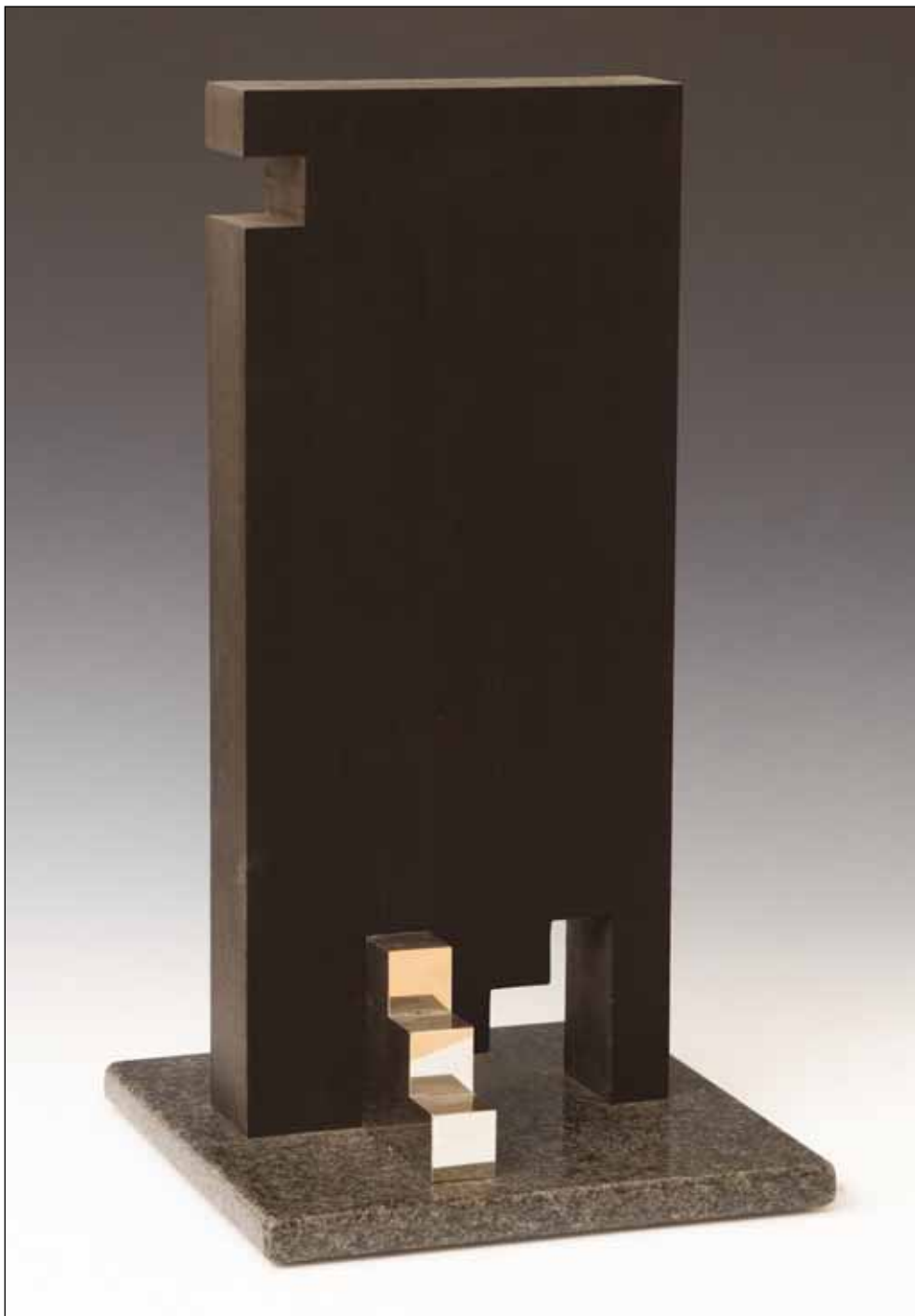
ÁTJÁRHATÓ TÉR I.