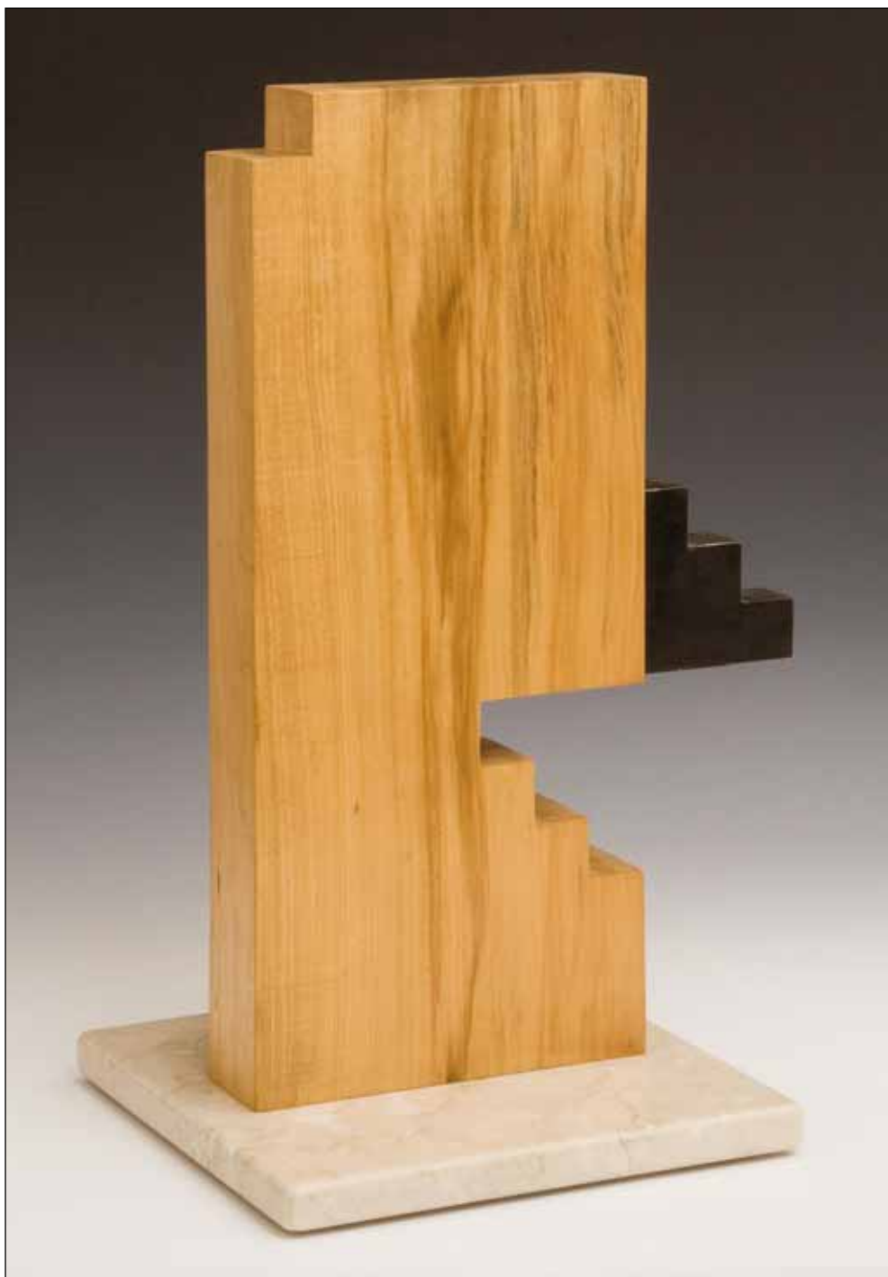
ÁTJÁRHATÓ TÉR III.