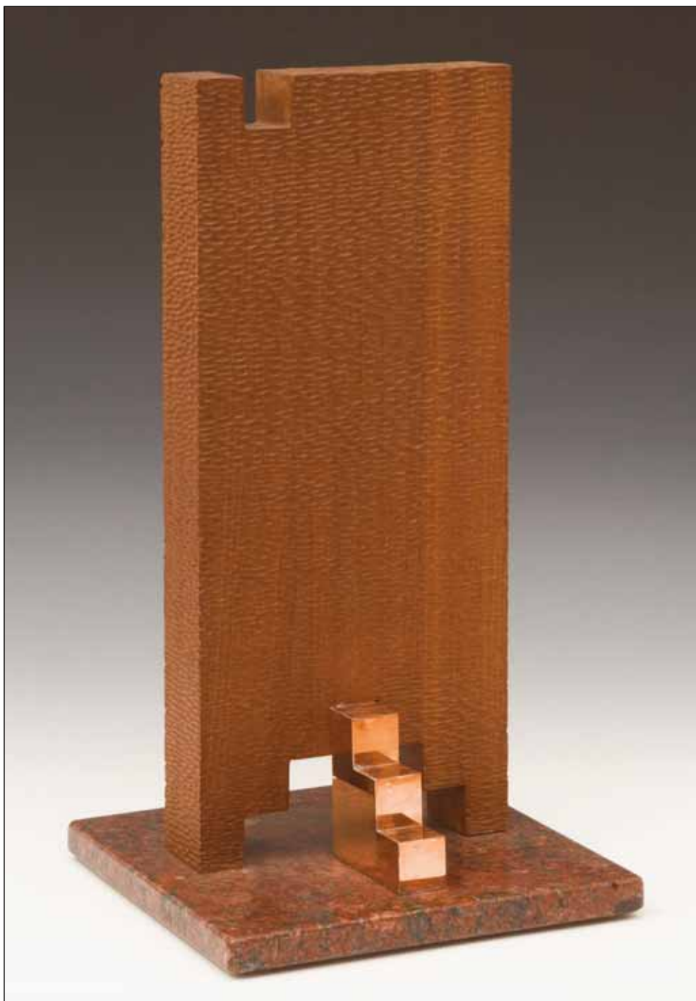
ÁTJÁRHATÓ TÉR II.