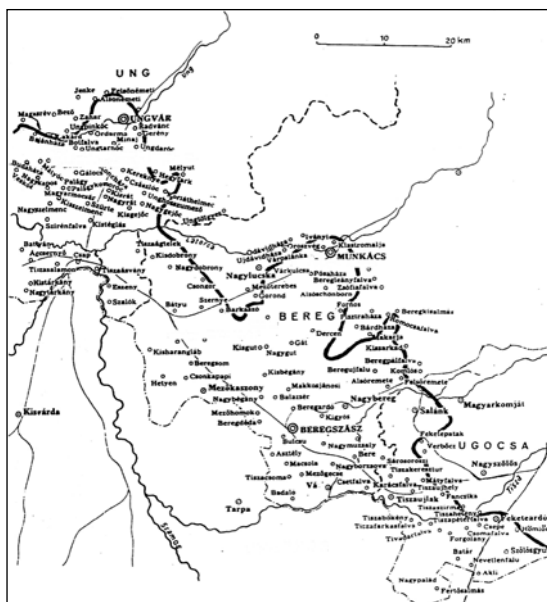
— Új északi határ - - - - Megyehatár - - - - Régi trianoni határ — Vasútvonal

Az első bécsi döntés által megszabott új határ a Tiszaháton, 1938. november 2.