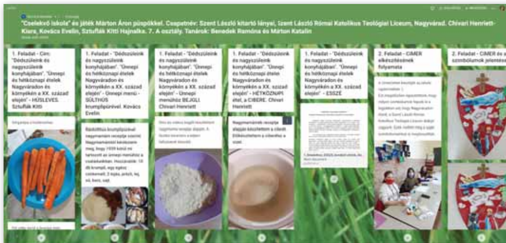
2. A nagyváradai Szent László kitaró lányai csapat padletje

A tanári reflexiók között örömmel olvastuk, hogy valóban sok csapat esetében sikerült az „alulról szerveződés”, ennek következtében váltak vezetőtanárrá ebben a zömében „humán profilú” játékokban természettudomány tanárok, osztályfőnökök is, vagy éppen a szépvízi román anyanyelvű romántanárnő, akinek részvételét igazi ajándékként élték meg a szervezők (és bizonytalán a gyerekcsapat is). Ugyancsak a tanároktól tudjuk, hogy a nem szokványos hirdetés és feladat kijelölés hatására sok olyan gyerek is bekapcsolódott a játékba, akik korábban nem jelentkeztek vetélkedőkre. A benevező csapatok nagy száma ugyancsak jelzi, hogy sikerült felkeltenünk a gyermekek érdeklődését.