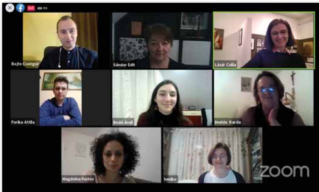
3. Az online értékelés pillanatai

Az étkezésről szóló projekt „elragadta” a csapatok többségét, a kértnél sokkal több és komplexebb ételt készítettek el, volt, aki a kakaskoppasztástól a kész sültig mindent bemutatott. Sok gyermek változatos forrásokat tárt fel a korabeli étkezési szokások megismerése érdekében (régi családi receptfüzetek, online archívumok, családi elbeszélések, interjúk a közösség idősebb tagjaival). Számos csapat nagyon szépen rendezte egy összefüggő projektté (filmmé, képes-szöveges bemutatóvá, online könyvvé, történetté) a megszerzett információkat és az elkészült ételek képeit. Legtöbb gyermek a közvetlen környezetéből gyűjtött információkat a „spórolós” ételekről, munkájukkal szépen szemléltetik, hogyan lehet a mai tantervek „fenntarthatóság” és „felelős erőforrás használat” céljaihoz közelebb kerülni a generációk közötti tanulásal. A mi gyermekeink tudatos fogyasztásra nevelését ne csak külföldi modellek adaptálásával, hanem a saját közösségük