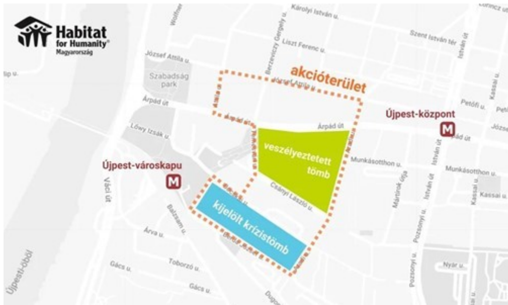
Az Újpest Kapuja térségmegújítási és városrehabilitációs projekt akcióterülete