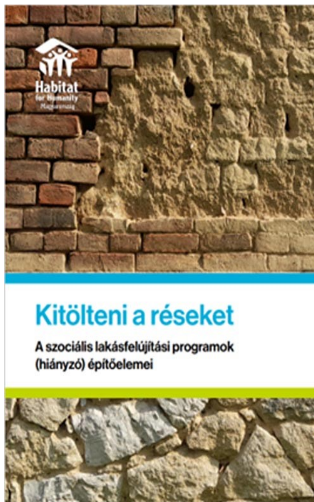
A tanulmány címlapja

PF: És akkor egy fél mondat volt a harmadik körből, a hatalmi szereplők köréből egy másik szereplőről, az önkormányzatokról, akiknek számtalan bajuk van, és nem feltétlen irigylésre méltó a helyzetük. De mégis az önkormányzat ott van, viszonylag közel azokhoz a helyekhez, ahol ezek a sérülékeny csoportok, családok, támogatásra szorulóknak vannak. Az önkormányzatokkal kapcsolatosan van-e általánosan elmondható tapasztalat?