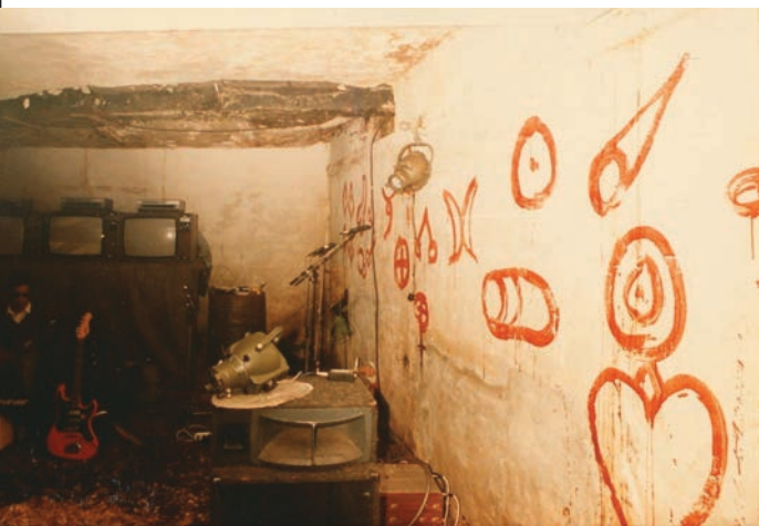
Effigatus Homo Deus Signatur in Auro , installáció és hangelőadás, Bergen, 1984

A freq_out olyan mű, amelynek egyedüli alkotóeleme a hang. Vizuális műalkotás nem szerepel a konstrukcióban. Ettől még a befogadó térben nem kell sötétségnek lennie. Koppenhágában és Csiang-majban nappali környezeti fényt használtunk, Berlinben és Oslóban egyszerű villanykörtéket, Kortrijkban és Párizsban pedig rafináltabb, piros lámpás világítórendszereket. A Moderna Museetben a termek a szivárvány hét színével voltak megvilágítva, mivel hét külön termet kaptunk. A termek értelemszerűen