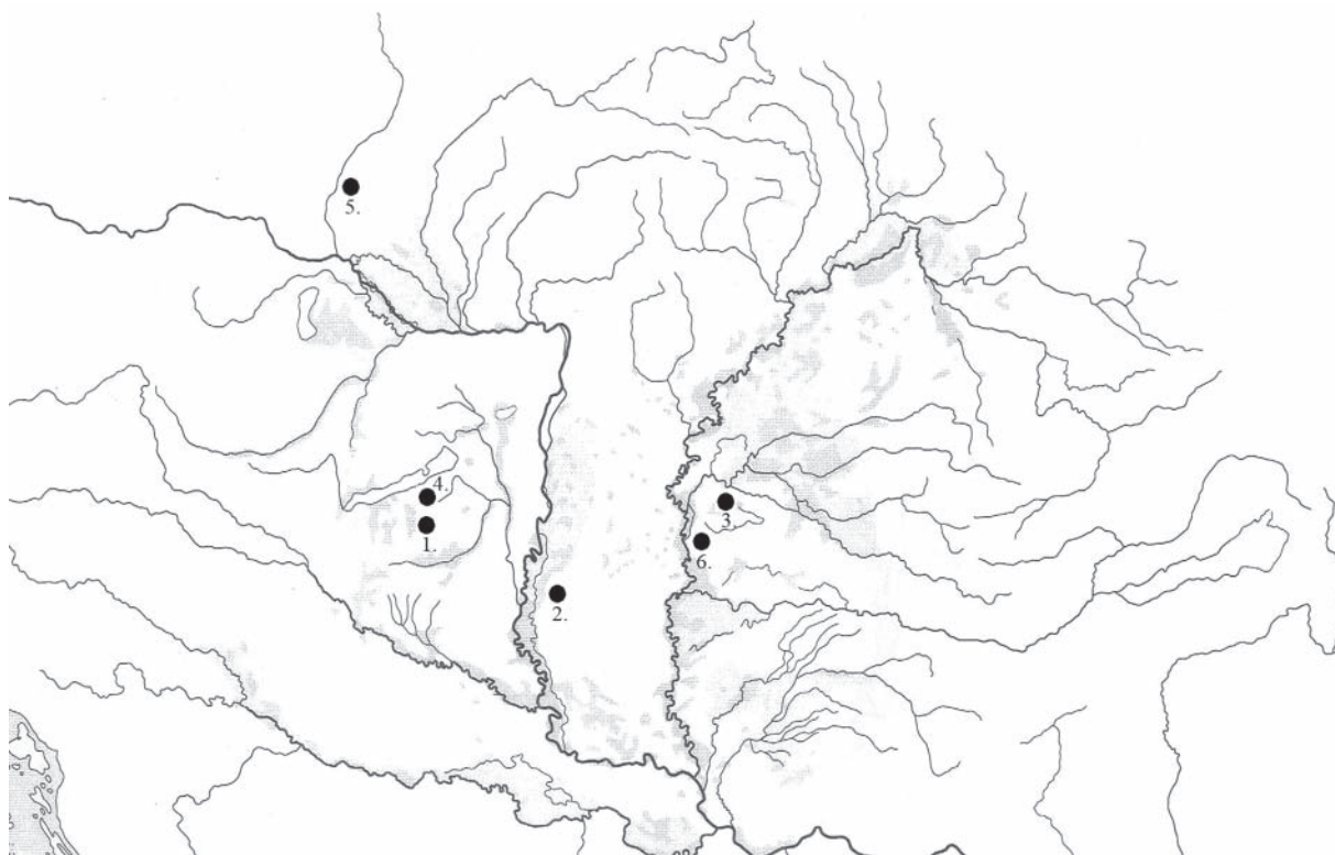
1. ábra. 1. Andocs-Temető utca, Orvos-ház; 2. Hajós – Cifrahegy; 3. Hunya; 4. Kereki – Homokbánya; 5. Morvaszentjános; 6. Szegvár-Szőlőkajla