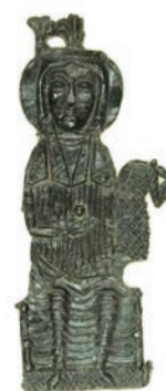
4. ábra. Zarándokjelvény töredéke Lippstadt-Bökenfördéből (HERBERS – KÜHNE 2013, 109.), a Szulok gyűjteményéből és ép darabja a veszprémi Lackó Dezső Múzeum gyűjteményéből (TÓTH – SCHLEICHER 2003, 27.)