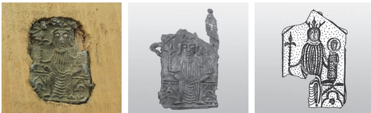
2. ábra. Aacheni Mária zarándokjelvény a gyűjteményből és wismari (ANSORGE 2008, 222.), trieri (Trier, Landesmuseum Inv.nr. EV 93,210, http://www.pilgerzeichen.de/search/index/dHJpZXI=/0/0/pz/3/0/0/+a- ) párhuzamai

Feltehetően a Bálványos melletti Csegéről (6. lelőhely) származik (méret: 3,5×2 centiméter) egy töredékes zarándokjelvény a 14. század első feléből (2. ábra). A lábaknál hangsúlyos, köztük vályúszerűen redőzött ruhában, két darab, háromszög alakú oromzat alatt háromkaréjos lóheredíszítéssel körülvett rozettával díszített trónuson közepén ülő Szűz Mária jobbában lilomot/liliomos jogart tart, bal oldalán hasonlóan sűrűn redőzött tunikában a gyermek Jézus áll egy párnán bal kezében glóbuszal. Szűz Mária fején lilimos korona található. Eredetileg a házat szimbolizáló zarándokjelvény tetején gótikus fiálék sorakoztak, a wismari darabon pedig a felvarrást lehetővé tevő fül is látható.