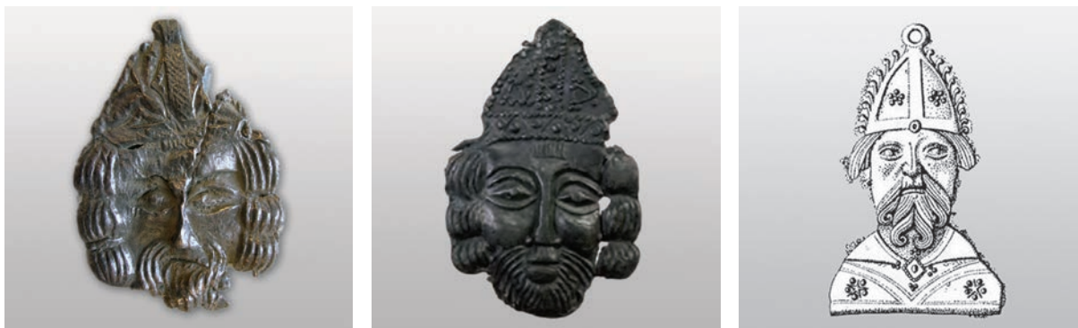
5. ábra. Szent Servatius püspökábrázolás a gyűjteményből, Wismarból (ANSORGE 2008, 225.), és egy változata a mezőszabadi harangon (BENKÓ 2002, 491.)

A 6. számú lelőhelyről származó 5×3,5 centiméteres töredék a szentet püspöki mitrával a fején ábrázolja (5. ábra). A bajszos, szakállas, profilált férfarcot hármasságba osztott, hosszú haj keretezi, míg homlokára függőlegesen osztott tincsből borul. A gyűjtemény darabján a szakáll szintén hullámos, a bajsz pedig hosszan konyul lefelé. Ugyancsak eltérések figyelhetők meg a csúcsos mitra kiképzésében, abban azonban egyeznek a példák, hogy egy, a középvonalban függőlegesen elhelyezett sáv osztja ketté, míg a két oldalon, valamint vízszintesen keretelősávot találunk. A somogyi példány kissé sérült darabján a középső sáv rácshálóval díszített, míg az arc feletti vízszintes sávon ferde vonalak között kidudorodó gyöngydíszítést találunk. A függőleges sáv két oldalán háromkaréjos díszítés húzódik, míg az itt felsorolt párhuzamain rozetta, illetve összekötött hármasság gyöngycsoportokból kialakított díszítés fordul elő. A függesztőfül a mitra két oldalán kapott helyet, míg a mezőszabadi harangon előforduló darabon a mitra csúcsán helyezkedett el.