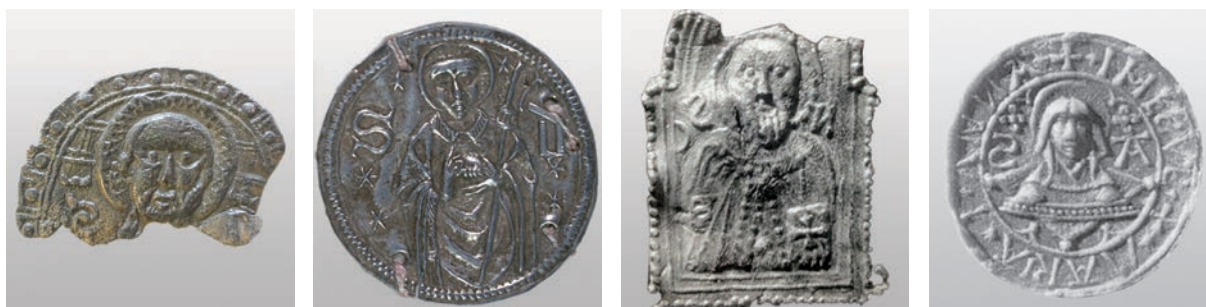
7. ábra. A gyűjtemény töredéke, Szent Dénes a D'Oiselet óráskönyvből ( https://commons.wikimedia.org/wiki/File:23_zilveren_pelgrimstekens.jpg ), Szent Miklós Bariból (RODIGHERO 2015, 113.), és Szent Anna a düreni zarándokhelyről ( http://www.kunera.nl/kunerapage.aspx , object number: 09344)

A 2. számú lelőhelyről származik az a 3,3×1,7 centiméter nagyságú töredék, melynek azonosítása egyelőre nem megoldott (7. ábra). A kör alakú zarándokérmét széles keretben kettős függőleges vonalkázással osztott pontozás szegélyezi. A kettős vonalon belül található a rácshálós glóriával övezett szent mellképe, amelyből csak feje maradt meg. A kopasz, szakállas férfiarc két oldalán fordított monogram és felette ívelt rövidítésjel található. A jobb oldali fordított S betű a Sanctus-ra utal, míg a bal oldali olvasata bizonytalan. A glória mellett vízszintesen futó kettős vonalak láthatók – közülük a jobb oldali függőleges vonalpárral osztott. Nagy számban vannak olyan zarándokérmék és zarándokjelvények, amelyeken egy szent látható a monogramjával. A Szent Dénes zarándokérem a 15–16. század fordulójáról származik és egy 23 zarándokérmét tartalmazó dél-holland óráskönyvbe volt bevarrva. A Bari-i kegyhelyről való Szent Miklós zarándokjelvény a somogyi töredékhez hasonló vonásokkal ábrázolja a szentet.