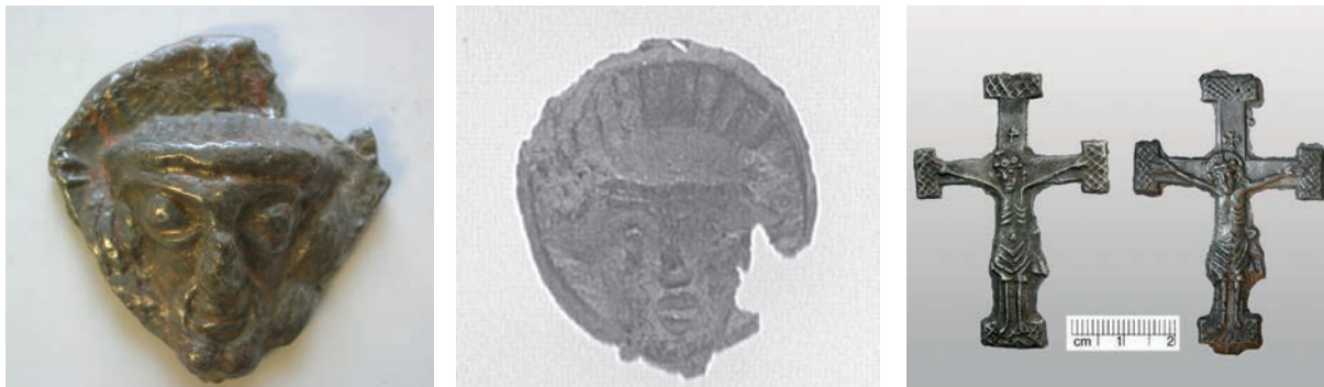
8. ábra. A gyűjtemény és egy párizsi töredék ( http://www.culture.gouv.fr/public/mistral/joconde_fr?ACTION=CHERCHE&FIELD_98=DENO&VALUE_98=enseigne%20de%20p%E8lerinage%20&DOM=All&REL_SPECIFIC=3 ), valamint strombergi kereszt Wismarból ( http://www.kulturwerte-mv.de/cms2/LAKD1_prod/LAKD1/de/Landesarchaeologie/Service/Bisherige_Funde_des_Monats/2011/01_-_unam_reysam_versus_Stromberch_/index.jsp )