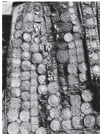
10. ábra. A rozettás érem és hasonló brakteáta veretek a halberstadti Szűz Mária szobor 14. századi köpenyéről (BENKŐ 2002, 176.)