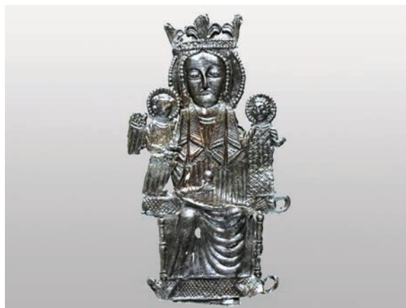
3. ábra. Szűz Mária zarándokjelvény töredéke és párhuzama a paderborni piactéri ásatásról ( http://www.archaeologie-online.de/magazin/nachrichten/archaeologen-geben-dem-paderborner-marktplatz-eine-neues-gesicht-30988/ )