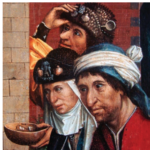
1. ábra. Szent Anna és Szent Joachim zarándoköltözetben flamand táblaképen (Frankfurti Történelmi Múzeum, http://www.spessartprojekt.de/spessart/ausstellung/pilger_03.php ):