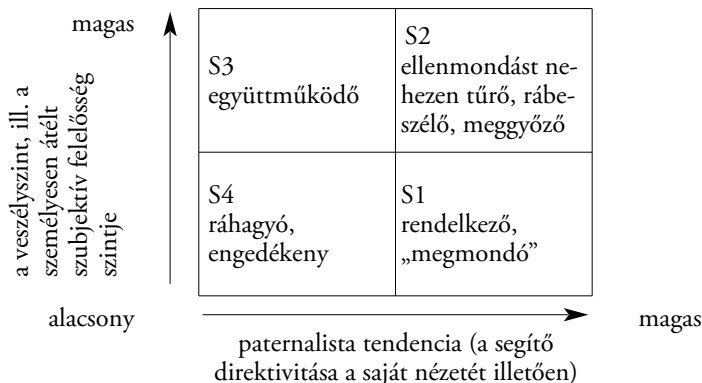
1. ábra: A segítő magatartását szemléltető ábra a segítői helyzetben 13

Ha koordinátarendszerben akarnánk ábrázolni a fent mondottakat – amilyen a vízszintes tengely jelenti a segítő (szülő, nevelő/pedagógus, orvos/etikus, pap/misszionárius) gyámkodásra irányuló tendenciáit, a függőleges tengely pedig a veszély (és az azzal járó felelősség) fokát – akkor a tengelyek által befogott tér négy mezője az alábbi négy figurát adja: