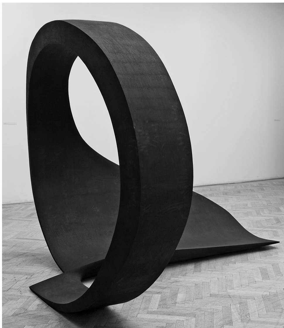
Kelemen Zénó: Phase