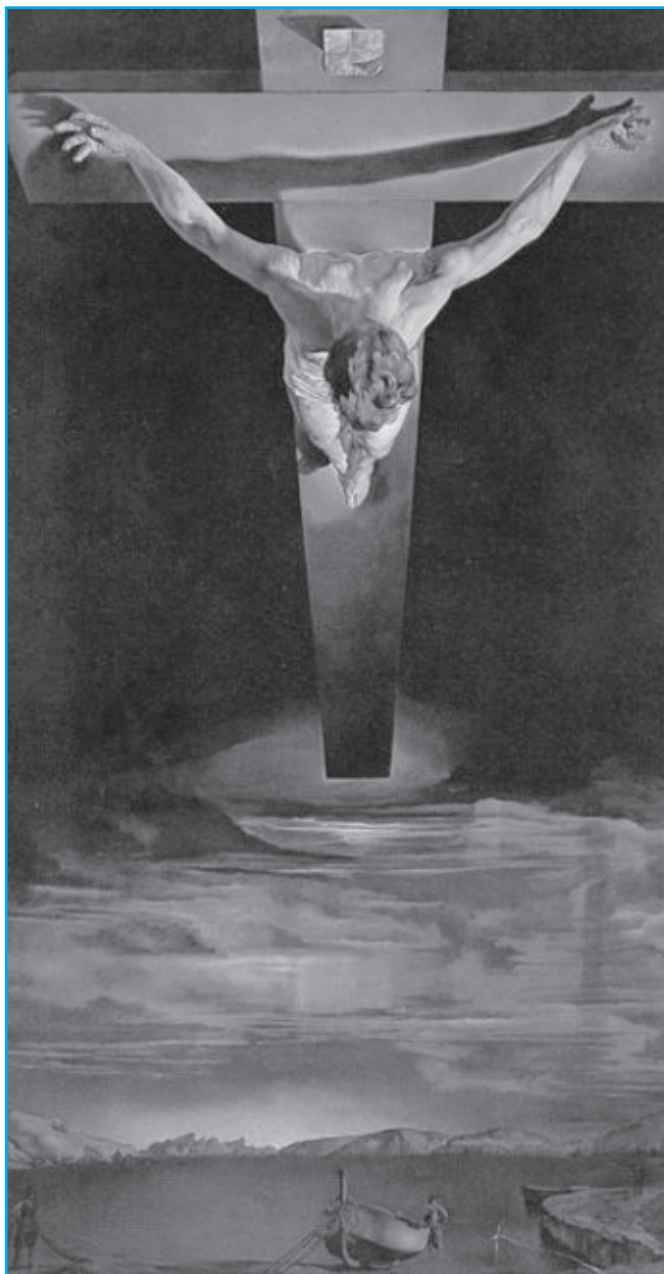
Keresztes Szent János Krisztusa Salvador Dalí festménye, 1951

A bünt fel kell dolgozni, meg kell bánni, ki kell ábrándulni belőle, meg kell tisztulni tőle. Meg kell gyógyítani a bűn okozta sebet, akár az emberről, akár a természetről legyen szó. Ennek ára van. Nem mi, hanem Krisztus fizette