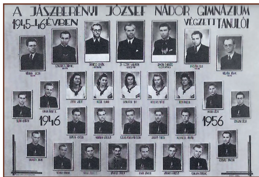
Érettségi tabló 1945-1946-ból

korú parasztfiú számára három hónapos bentlakásos (népfőiskolai!) tanfolyamot szerveztek és fejeztek be. (...) «Tanárok, diákok lovas kocsikon járták a város tanyavilágát a vándorkönyvtár anyagával, hogy egy-egy tanyaközpontban színes előadásokkal, irodalmi művek megjelenítésével s más, változatos módon érdeklődést keltsenek [...] az olvasás iránt.» [...] a jól végzett és eredményes munkára tekintettel javasolta a Szolnok megyei Szabadművelődési Felügyelőség a minisztériumnak, hogy a Jász-Nagykun-Szolnok vármegye szabadművelődési ügyvezetői részére rendezendő egyhetes továbbképzési tanfolyam megszervezését és lebonyolítását bízza a jászberényi tanítóképző tanári karára.