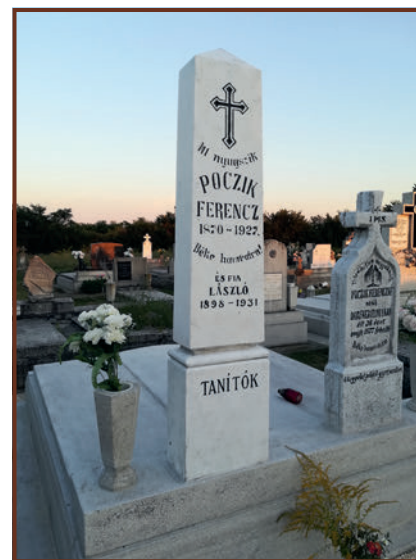
Poczik sírok a felújítás után

tanító dinasztíának majd évszázados tanítói munkásságát. A felvetést tett követve, az elszármazott és helyi lokálpatrióták körében gyűjtést szerveztek a síremlékek felújításának költségére.