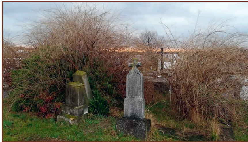
Poczik sírok a felújítás előtt