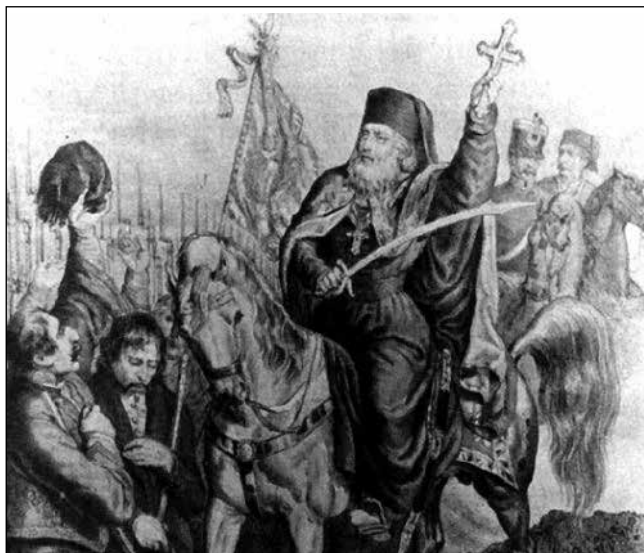
Josip Rajačić pátriárka a karlócai szerb nemzeti gyűlésen (1848. május 13–15.)