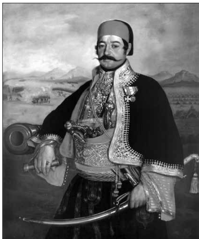
Stevan Petrović Knićanin (1807–1855), a szerbiai önkéntesek parancsnoka, jellegzetes szerb viseletben

Szeptember hónap végén is hallattak magukról a szerb lázadók, mivel szeptember 22-én elfoglalták Ürményházát (Јерменовци/Jermenovci) és Zöldest. Mindkét települést feldúlták, kifosztották és felégették. Zöldes többé nem épült fel. 44 A szerbek elfoglalták továbbá a jobbra német ajkú Zichyfalvát (Пландиште/Plandište) is.