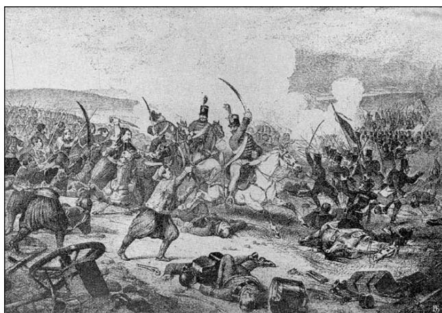
Az alibunári csata (1848. december 12.)*