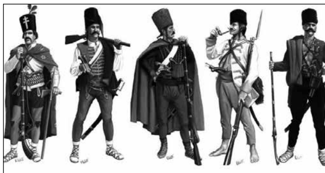
Szerb granicsárok (határőrök) a 18–19. század fordulóján

A Bánság területe a pozsareváci békekötéssel – 1718. július 21-én – szabadult fel a török iga alól. A térséget – 1716-ban – visszahódító császáriak azonban már jelentősebb számú szerbet, illetve román találtak a térségben. A bécsi udvar előszeretettel foglalkoztatta a szerbeket, mint határőröket. Katonáskodó, fegyveres életmódjukhoz egyéb jelentős jogok – például adó kiváltságok – is társultak. A szerbek csakhamar több jogot élveztek Magyarországon, mint a Habsburgok – de különösen az I. Lipót regnálása (1657–1705) – alatt elnyomott, senyvedő magyarság.