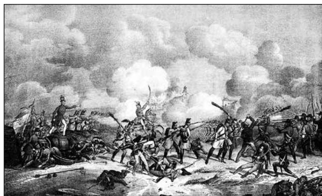
A perlaszi ütközet (1848. szeptember 2.)

el. Bevételeét nehezítette, hogy sáncok, árkok, továbbá tüzérségi ütegek is védték. A tábor védelmét körülbelül 5000 fő – ebből 4 ezer határőr, 800 szerviánus és 200 titeli sajkás – és 12 kis kaliberű löveg látta el. A védelmet Jovan Drakulić szerb ezredes vezette.