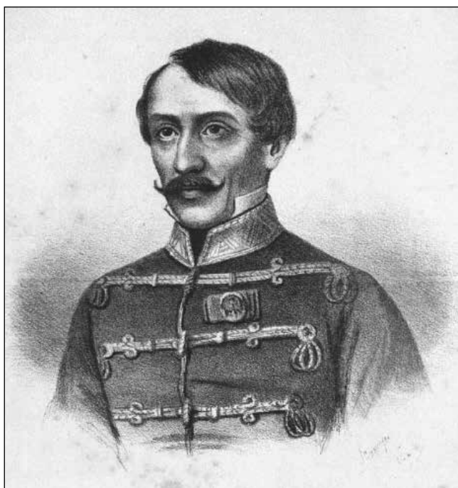
Eleméri és ittebei Kiss Ernő (1799–1849) honvéd altábornagy, aradi vértanú

Kiss Ernő ezredes, a 2. (Hannover) huszárezred élén, 1848. július 14-én visszafoglalta a szerb ajkú Tiszatarróst (Тараш/Taraš), és az „elegyes” – román, szerb, német és magyar – lakosságú Écskát (Ечка/Ečka) az aznap fellázadt helyi és szerviánus szerbségtől. Ezt a lépést a két helység Nagybecskerekhez viszonyított közelsége is indokolta. A szerbek ebbe nem nyugodtak bele, és már július 15-én a közeli perlaszi táborból egy szerb lázadó csapat indult Écska visszaszerzésére. A csata „döntetlen” lett. A szerbek