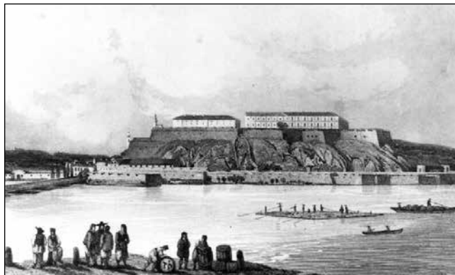
A „Duna Gibraltárja”, a pétervárad erőd egy korabeli metszeten

lót, és állt a magyar ügy mellé. Pétervárad végül Munkács (Мукачево) várával és Komárom erődjével a legtovább tartott ki a magyar szabadságharc ügye mellett.