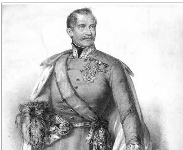
Stefan Šupljikac (1789–1848) szerb származású osztrák vezérőrnagy, a Szerb Vajdaság vajdája

A magyar kormány már 1848. június 13-án felszólította Torontál vármegyét, hogy két hét alatt állítson ki 3000 határőrt, lőfegyverrel vagy ennek hiányában kaszákkal felfegyverkezve, és használja fel őket területének védelmére. Erre nagy szükség volt, mert – 1848. június 6-án – a szomszédos Csajkás kerületben a szerb granicsárok elfoglalták a titeli (Тител/Titel) lőszerraktárt, és onnan nyolc löveget vittek magukkal. A péterváradai erőd katonai helyőrsége már június 12-én támadást intézett a karlócai szerb tábor ellen. Másnap a szerb főodbor már az összes szerbet felszólította a magyarság elleni harcra. Érdekességként közöljük, hogy a magyar minisztertanács június 21-én – július 15-i hatállyal – megtiltotta a kasza kivitelét Szerbiába, illetve Boszniába. Azonban az eseményeknek már nem lehetett megálljt parancsolni. A Torontállal ugyancsak szomszédos katonai határőrvidék német-bánsági ezredének területén két, románok által lakott falut – Végszentmihályt (Локве/Lokve)