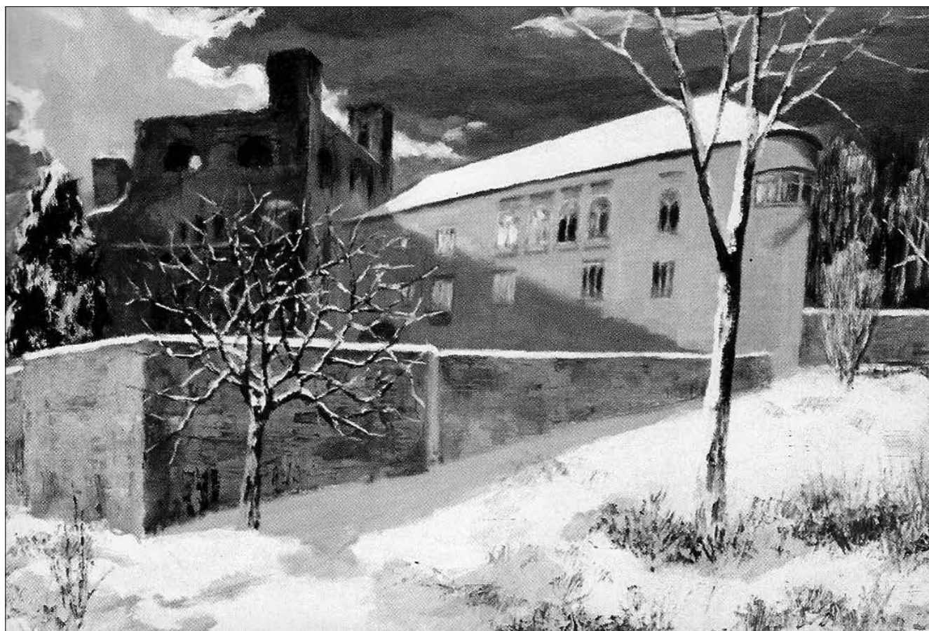
A pataki vár

A Wass Albert Könyvtár és Múzeum honlapja: http://www.vktapolca.hu/cgi-bin/tlwww.cgi?show=da197277