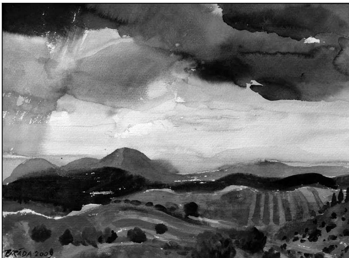
A viharfelhő árnyéka