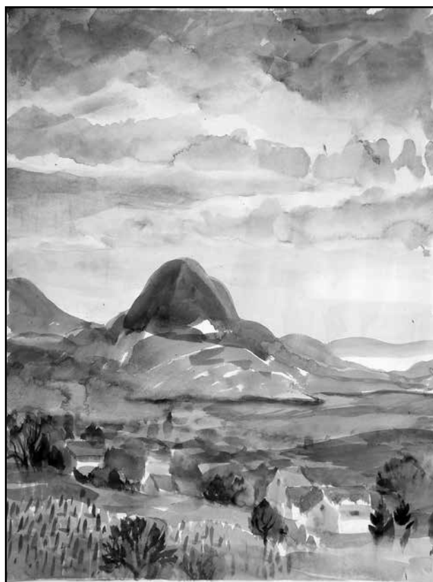
A Szent György-hegyen