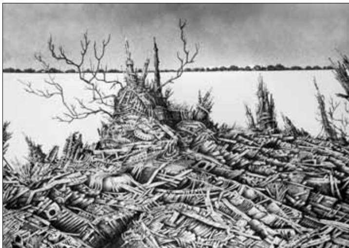
Palics III., 2011