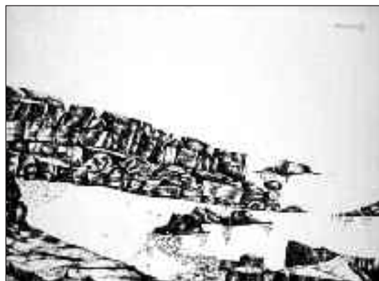
Sziklák 6., 8.