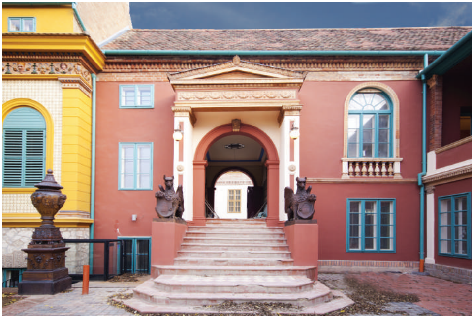
Pirogránit épületdíszek a villa neoreneszánsz homlokzatán