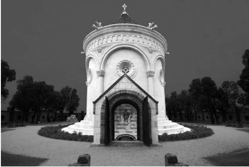
A Zsolnay Mauzóleum

A tervezők tudatában voltak annak, hogy a szokásosnál – például a Ganz gyár átalakításával készült Millenáris Parkénál – jóval összetettebb szituációval van dolguk. Mivel a három vezető tervező egyike sem pécsi, elfogulatlanul, preconcepciók nélkül tudták felmérni a feladatot és a lehetőségeket, ugyanakkor nem hagyhatták figyelmen kívül a helyi közvélemény és a korábbi koncepcióalkotók elvárását sem, amely a negyedben a Zsolnay legenda érzelmi motívumait erősítette volna fel. Világos volt számukra, hogy a heterogenitás, az architektúra és a használat sokfélesége, nyitottsága a sikeres terv kulcsa, ezt segítette elő a munka felosztása a tervezői csoportok között, akik az érdeklődésüknek, habitusuknak megfelelő feladatokat kapták, és elmondásuk szerint meglehetősen nagy szabadságot élveztek munkájuk során. A pályázat többi, megvételt nyert tervével összehasonlítva értékelhetjük igazán, hogy az MCXVI tervezői az épületállomány egyes történeti rétegeit, a műemléki védettségű, reprezentatív, egykor lakófunkciójú épületeket, a Zsolnayak korában épült ipari műemlékeket és a meghagyott 50-es, 60-as, 70-es években készült hozzátoldásokat, valamint az új hozzáépítéseket egységes egészé tudták összefogni, szemléleti és minőségi egységként tudták megjeleníteni.