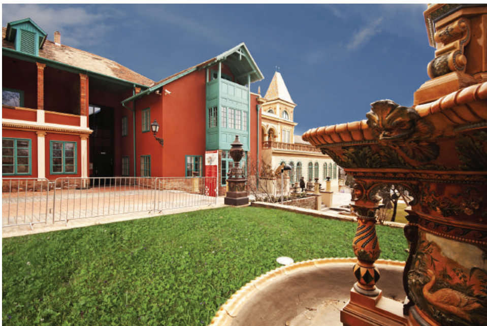
A műemlékvillában rendezték be a Zsolnay család és a gyár történetét bemutató kiállítást.