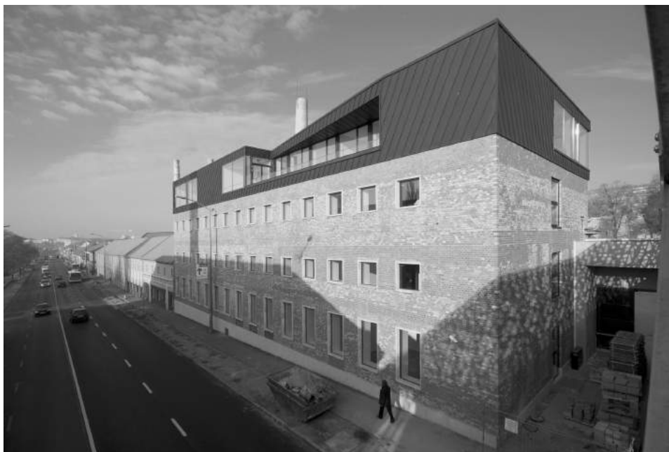
Pillantás a hídról: a Kommunikáció- és Médiatudományi Tanszék épületének Zsolnay úti homlokzata.

Zsolnay kerámia historizáló és szecessziós darabjait bemutató Gyugyi-gyűjteménynek ad otthont. Ide tartozik a külpontosan elhelyezkedő Zsolnay-mauzóleum, az Alkotó- és Inkubátorház, valamint a Kézművész utca üzletsora. Az Alkotó negyed a páratlan atmoszférájú Pirogránit udvarral a fesztiválok elsődleges helyszíné; itt található az E78-ként is emlegetett Ifjúsági Központ, melynek sima üveghomlokzata az intézmény elődjét, a belváros határán álló egykori Ifjúsági Házat idézi. A Gyermek- és Családi Negyed az interaktív tudományos-technikai kiállítások iránt érdeklődőket várja. Központi elemei az egykori gyári labor helyére települt Interaktív Varázstér, mely tartalmilag bevallottan a budapesti Csodák Palotájának mintáját követi, a Planetárium, a Pécsi Nagyalgéria támfalba húzott épülete, valamint az egykor szintén a lakóépületnek épült, majd évtizedekig művelődési házként működő „Zöld ház”, ahol a Bóbita Bábszínház kapott helyet. A Zsolnay Vilmos út által két részre osztott Egyetemi Negyedben a Pécsi Tudományegyetem Művészeti kara, a Bölcsészkar két tanszéke és a Janus Egyetemi Színház működik.