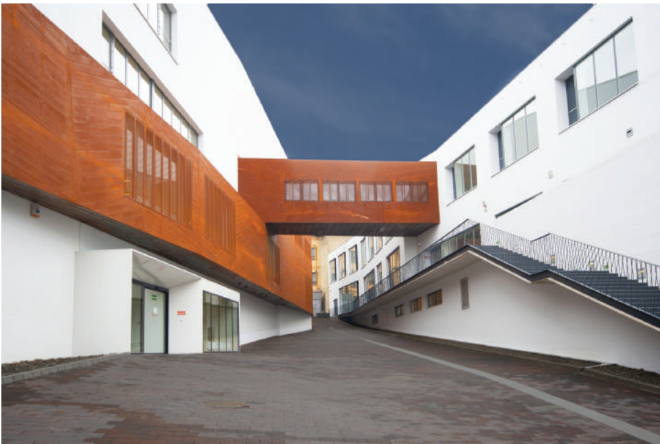
A Zeneművészeti Intézet homlokzatának kortencél burkolata az együttes ipusztriális eredetére utal.