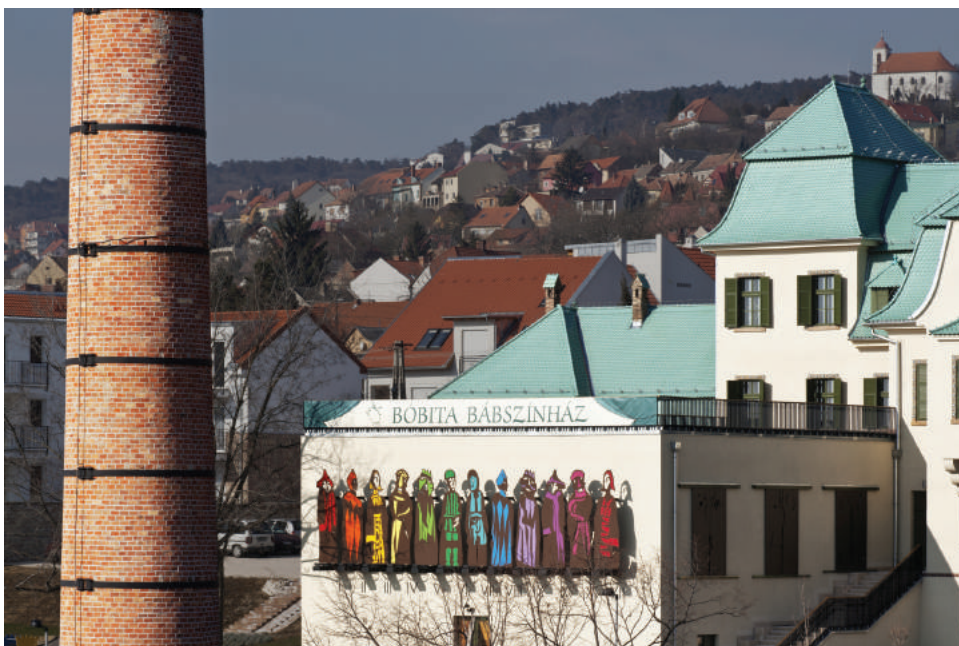
A Bóbita „bábórája”