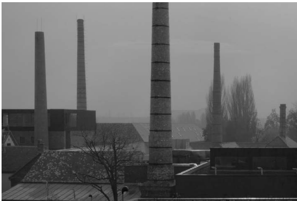
A kémények a Zsolnay Negyed emblematikus városképi elemei.