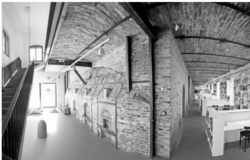
A Művészeti Kar könyvtárát az egykori égetőkemencében rendezték be.