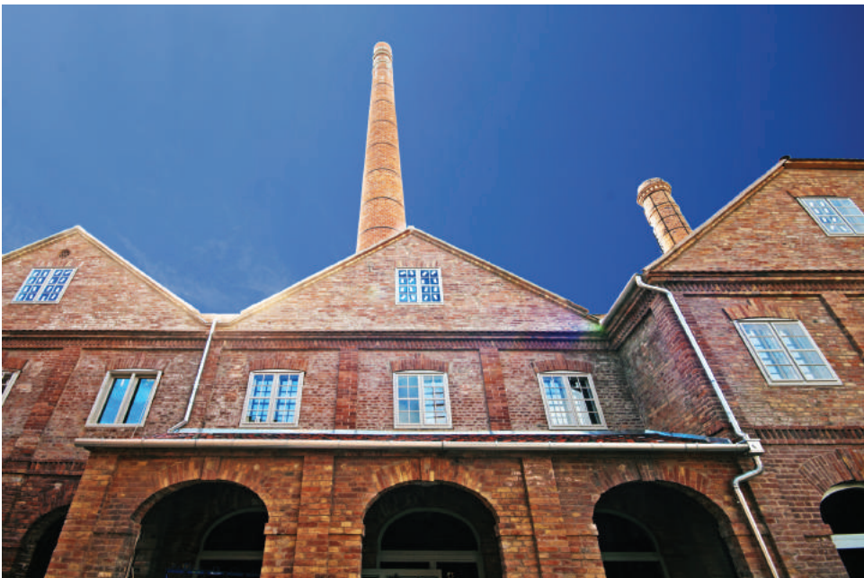
A Pirogránit Udvar ipari műemlékeinek téglaoornamentikája