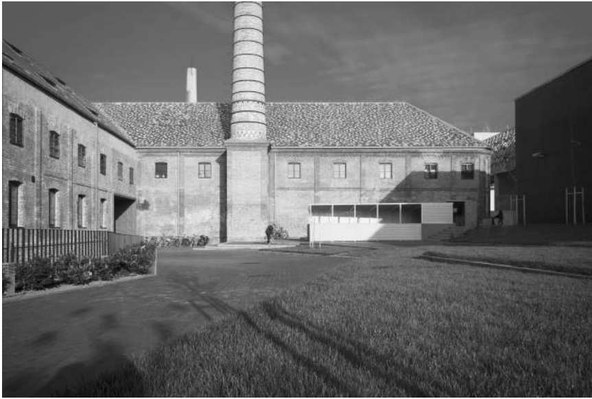
Az egyetemi negyed déli része a Festészeti Tanszék épülettömbjeivel.

A kreatív ipar különféle szegmenseinek részletezése mellett a környezeti tényezők között a történetileg és kulturálisan rétegzett, karakteres és inspiráló, ugyanakkor a kísérletezésre is terepet nyújtó épített környezetet, a változatos és adaptív épületállományt, az aktív közterületeket, a street art tevékenység és a mikrourbánisztikai eszközök hangsúlyos jelenlétét, illetve az úgynevezett „aktív homlokzatok” (active street frontages) meglétét említi. A kreatív rétegre jellemző sajátos életforma, az eleven éjszakai élet (evening economy) feltételeit, az árszínvonal és arculat szempontjából egyaránt változatos vendéglátást és a negyed átjárhatóságát, a városi szövetbe való integrációját szintén elengedhetetlennek tartja.