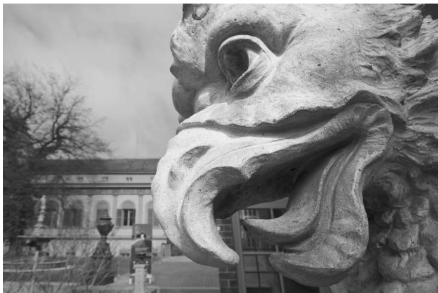
A családi rezidencia annak idején a gyár épületkerámia termékeinek bemutatására is szolgált.