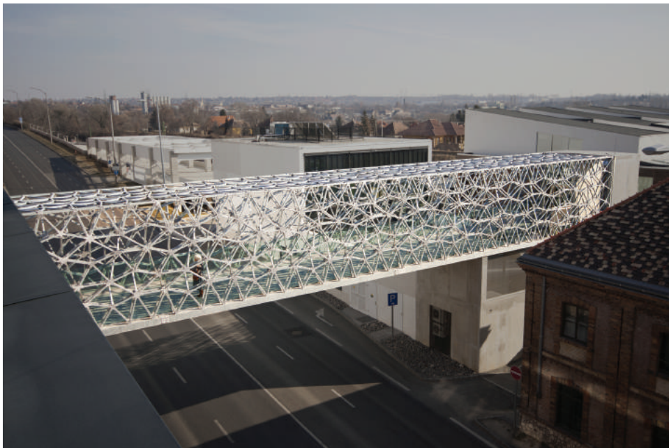
A gyalogoshíd a negyed északi és déli részét kapcsolja egymáshoz.