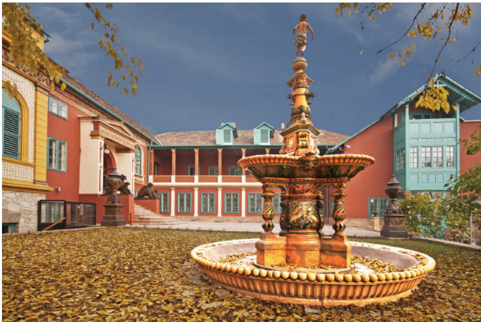
Míves Negyed, Kutas Udvar