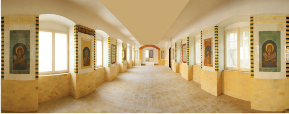
Apostolos: A Míves Negyed rendezvényterme mázas kerámia képeinek témájáról kapta a nevét.