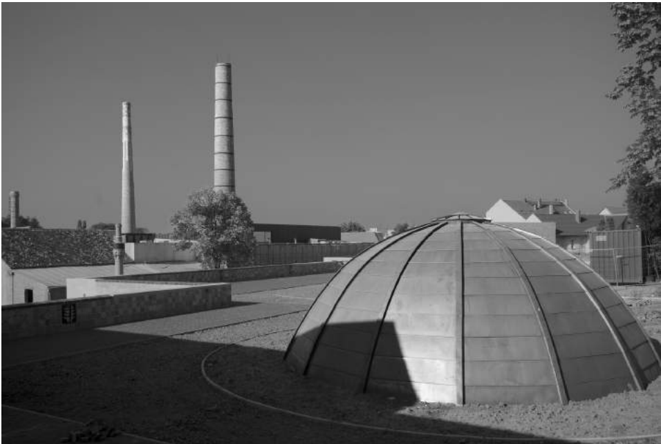
A Családi Negyed a Planetárium kupolájával