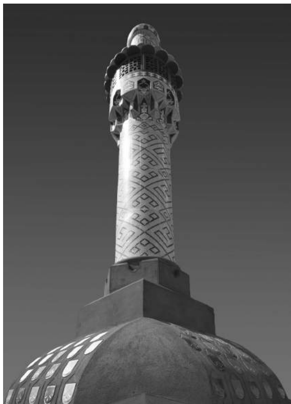
Az egykori jégverem „minaretjének” ornamentikájához az iszfaháni mecset szolgált mintául.