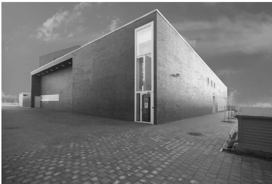
A Szobrász Tanszék és a Janus Egyetemi Színház minimalista tömbje a téglaburkolat révén kapcsolódik a műemlék épületekhez.

A kifogások közül a kulturális ipar, a kreatív réteg és a piaci szereplők távolmaradása (az Alkotónegyed számos épülete és több üzlethelyiség ma is üresen áll) s mindezek következtében a negyed fenntarthatóságával kapcsolatos aggodalom fogalmazódott meg a legmarkánsabban. A civil kezdeményezések kiszorulása, a belváros kulturális elszegényítése, a kulturális fogyasztás „plázaszzerű” koncentrációja, a városszövetbe nem illeszkedő, zárványszerű elkülönülés kifogása szintén gyakran felmerül. E vádak igazságtartalmának tisztázása, az okok feltárása és a változtatások irányának kijelölése a jövőben tovább bővülő társadalmi diskurzus feladata. A negyed funkciójára vonatkozó elképzelések rövid áttekintése, melynek bizonyos elemei tovább élnek a megvalósult projektben és a hozzá fűződő várakozásokban, valamint az architektúra programalakító szerepének elemzése azonban talán közelebb vihet a ZSKN sajtószerevének megértéséhez.