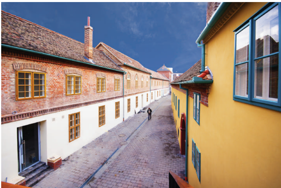
A Boltok utcája jelöli ki a Negyed északi határát. A földszinten üzletek, az emeleten a Zsolnay Örökségkezelő Nkft irodái sorakoznak.