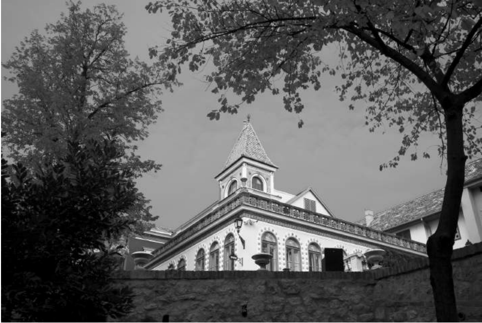
A Zsolnay Étterem és Kávézó terasza a villában