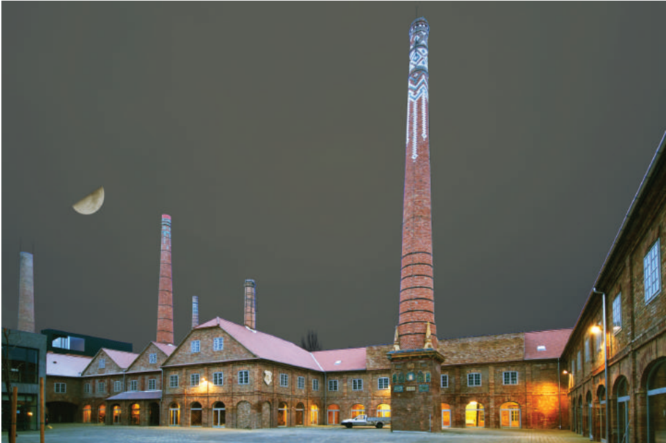
A Pirogránit Udvar a Cifra kéménnyel