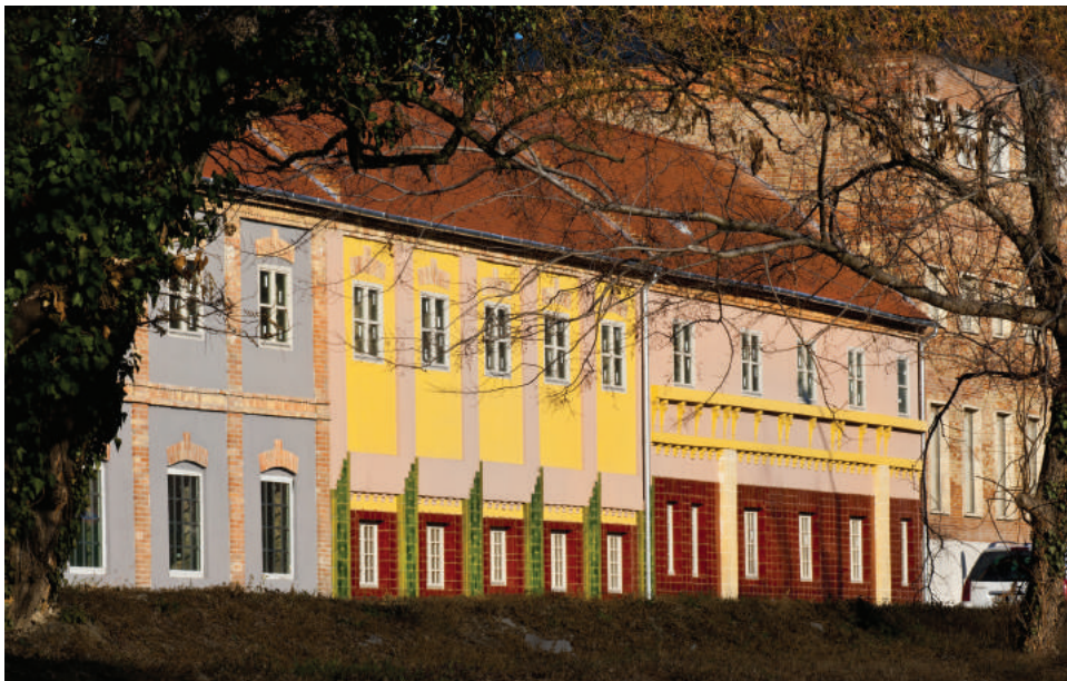
A Zsolnay úti homlokzatok mázas kerámia díszítményei