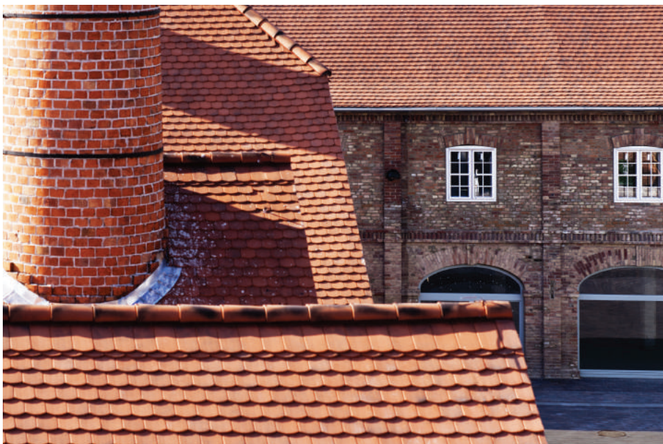
Az egykori üzemépület részlete