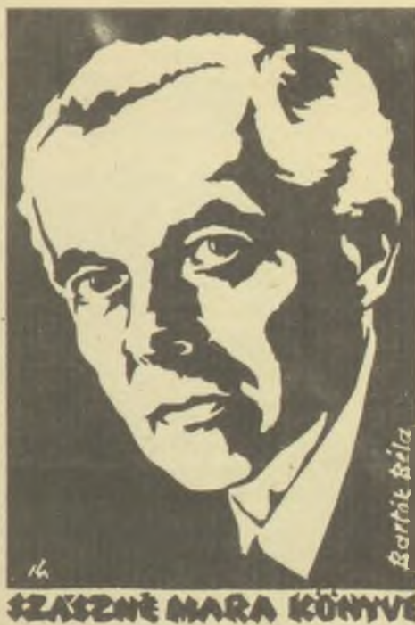
Marcali Kiss József lírdmetszete, X3

Az 1999 júliusában elhunyt Marcali Kiss József festő- és grafikusművész családja, karöltve Érd város Önkormányzatával, két rendezvényt emlékeztek meg a neves művészről, a városnak immár örök lakójáról. Családi házában május 15-én délután emléktáblát avattak, amely megőrökíti emlékét és a helyet, ahol élete utolsó évtizedében élt és alkotott. A népes közönség előtt Harmat Béla , érdi polgármester mondott avatóbeszédet, méltatta M. Kiss József művészetét, és emlékezett meg nemcsak az alkotóról, hanem a város polgáráról, az emberről és a barátról is, aki igazi otthonra lelt itt. Az emléktábla leleplezése után a család tagjai, a barátok és a tisztelők koszorút helyeztek el a ház udvarán a művész hamvai fölött álló szobor talapzatára.