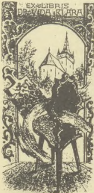
Bálint Ferenc rézkarca, C3, C5

Kolozsvár tájait, hangulatait idézik. Kiállított 48 ex librise pedig a rá jellemző finomsággal, lágy színharmoniókkal vezeti be nézőit az igazi „bálintferenci” kisgrafika világába. Mind egyszínű, mind színes ex libriseinek egy részén a kisebb méretű rézkarcot dombornyomású keret veszi körül, vagy válik egyenrangú részévé a dombornyomású kompozíciónak; másrészt a színes grafikába épülnek bele a dombornyomatok és