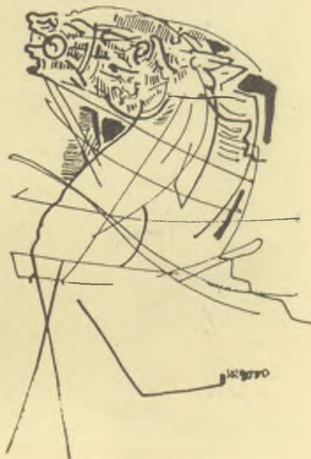
König Róbert rajza