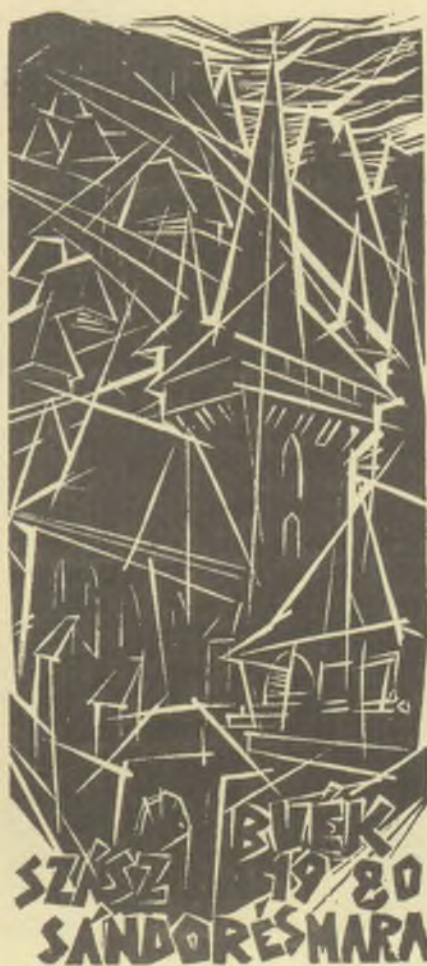
Imets László jametszete, X2