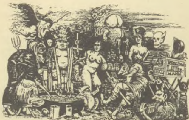
Vén Zoltán rézmetszete, C2