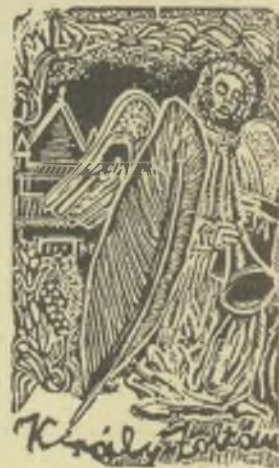
Moskál Tibor rézmetszete, X3