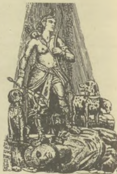
Vén Zoltán rézmetszetei, C2