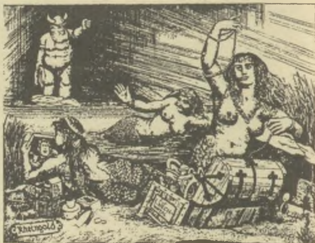
Vén Zoltán rézmetszete, C2