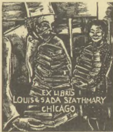
Buday György fametszete, X2

A MAGYAR NEMZET február 23-i száma Galéria-rovatában megemlékezést közölt Buday György (1907–1990) grafikus-művészről, halálának tizedik évfordulója alkalmából. A (mezei) aláírással jelzett cikk szerzője elmondja, hogy a hosszú ideig Angliában élt művészt itthon kétszer fosztották meg magyar állampolgárságától: 1941-ben és 1949-ben. A Szegedi Fiatalok Művészeti Kollégiuma elnökeként szerepe volt a magyar falukutató mozgalom megindításában. nevéhez fűződik az 1931-ben megjelent Boldogasszony búcsúja, az első magyar fametszetes könyv. Az Ortutay-gyűjtötte Székely népballadák kötetének az ő drámai hangvételű fametszetei is fokozták sikerét. A szerző a művész életének utolsó éveibe is bepillantást enged, amikor elmondja, hogy az 1956 miatti tragikus depresszióból kigyógyulva Buday egy London közeli idegstanatórium megnyugtató közelségében dolgozott haláláig. Az ex librisek világában is maradandó nyomokat hagyott maga után, e műveinek alkotásjegyzéke, annak összeállítása hiánypótló lenne. Reá emlékezésül egyik 1981-ben készült fametszetű ex librisét közöljük.