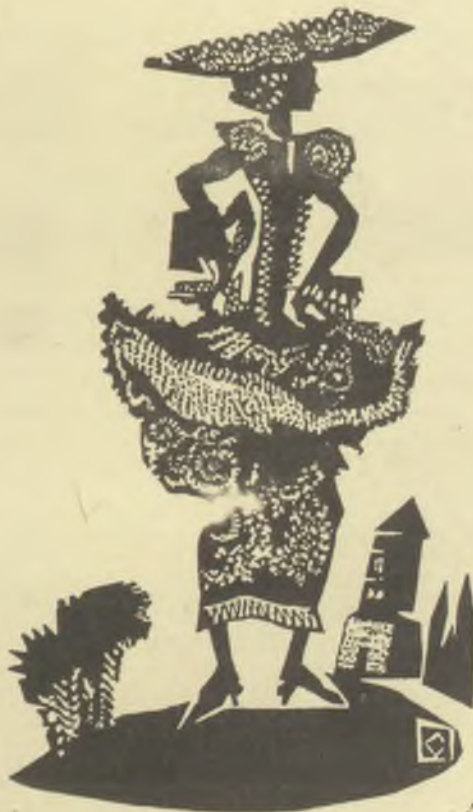
Kopasz Márta linómetszete, X3