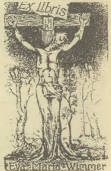
Bálint Ferenc rézkarca, C3, C5