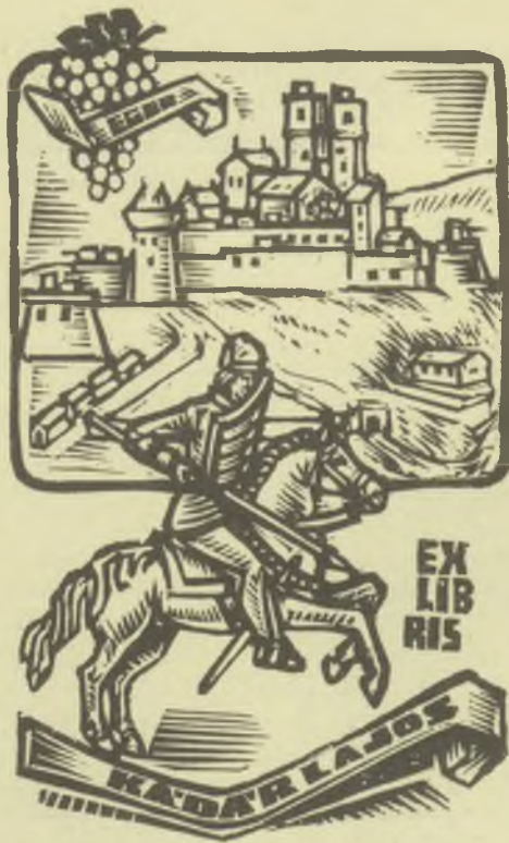
Fery Antal fametszete, X2