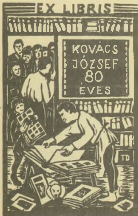
Takács Dezső linómetszete, X3