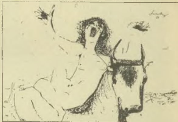
Szalay Lajos fametszetei, X2