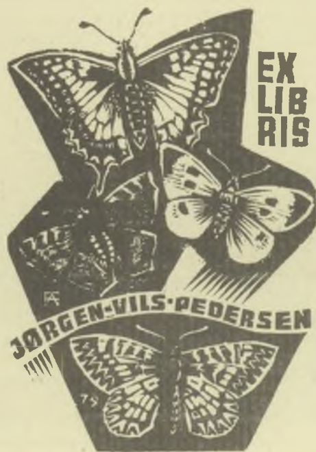
Fery Antal fametszete, X2+X3/2

A belga GRAPHIA 122. száma kegyeletteljes szavakkal emlékezik meg Fery Antal elhunytáról, megemlítve, hogy a művész mintegy ezer ex librist alkotott, amelyekről még nem jelent meg megbízható alkotásjegyzék. – Vitába kell szállnunk a lap LV szignójú munkatársával: egy grafikusművész életművét nem szabad megcsonkítani oly módon, hogy csak az ex libriseket veszi számba. Az alkalmi grafikák (karácsonyi, újévi lapok, eseményeket megörökítő kisgrafikák) különösképpen Fery Antalnál a 2400 darabból álló életmű szerves részei, amelyek az ex librisekkel párhuzamosan készültek. A művész fantáziáját, humorát, komponáló készségét legalább olyan jól tükrözik, mint az ex librisek.