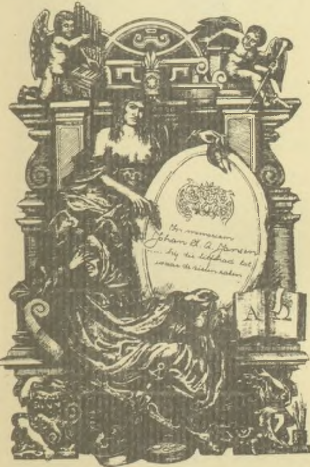
Vén Zoltán rézmetszete, C2