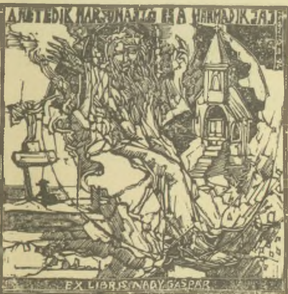
König Róbert rézmetszete

Az ex libris latinul annyit tesz, hogy ... könyveiből. Valakinek a könyveiből, aki rendszerint néven nevezi magát, sőt, különösen az előző századokban egyéni vagy családi jelmondatát is elárulja. Az ex libris körülbelül a XV. század óta ismeretes Európában. Először a könyvtábla címlapján jelent meg felírás – gondoljunk Mátyás király világhírű Corvináira. Jóval később alakult ki csak a szokás, hogy a könyv belső oldalára jegyezte be a tulajdonos a nevét, méginkább – s ilyenek az itt látható értékes munkák – amikor egy kisgrafikának számító metszet vagy karc nyomata került beragasztva a könyvtáblára. Ezt nevezzük ma általánosan ex librisnek, amely immár önálló művészeti ágnak is mondható; ezenfelül pedig a kisgrafika kedvelőinek önálló gyűjtési területe.