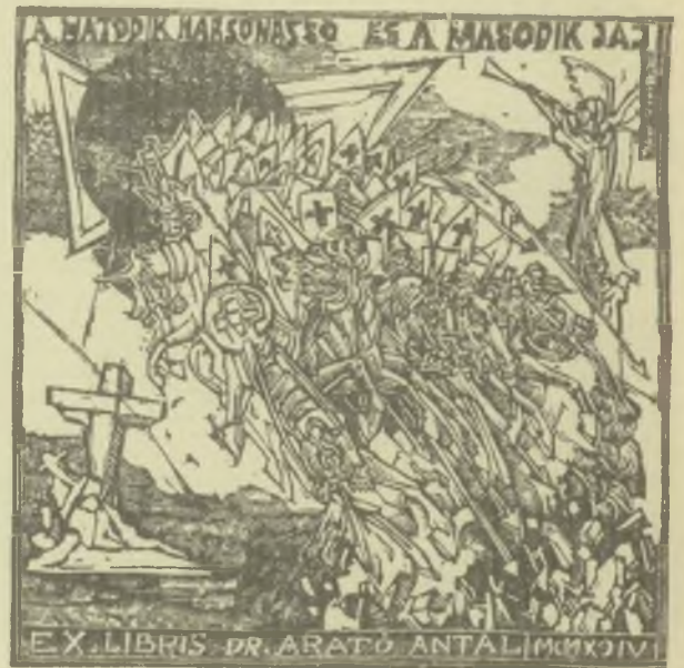
König Róbert rézmetszetei