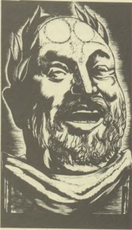
Buday György fametszete XI

utolsó fametszet-sorozata is a magyar irodalom szolgálatának a jegyében készült. A magyar költészetet angol fordításban bemutatandó antológiába 25 portrét készített magyar írókról. (Az antológia nem jelent meg, ám a portrékat közölték a hazai irodalmi folyóiratok.)