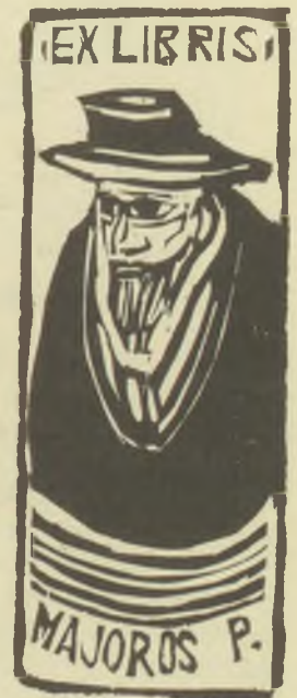
Perei Zoltán metszetei