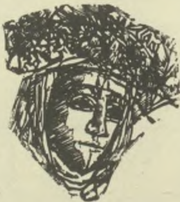
Gáborjáni Szabó Kálmán famatszete X2