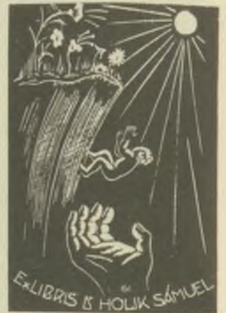
König Róbert famatszete X2