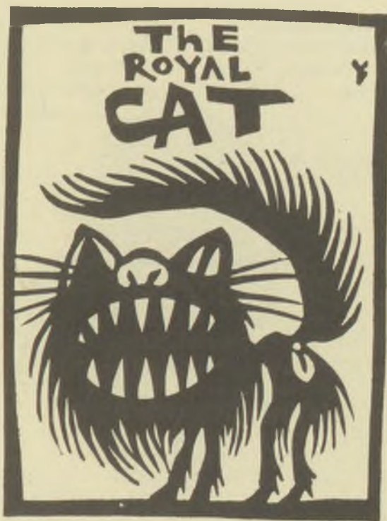
Vincze László linómetszetei X3