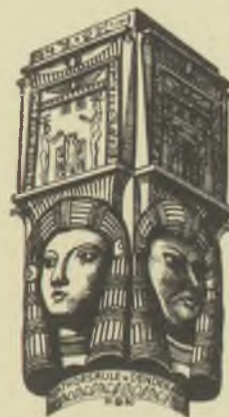
EX LIBRIS DR. GERNOT BLUM