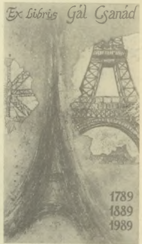
Bálint Ferenc rézkarca C3, C5