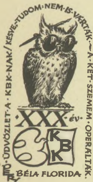
Petry Béla rajza P1