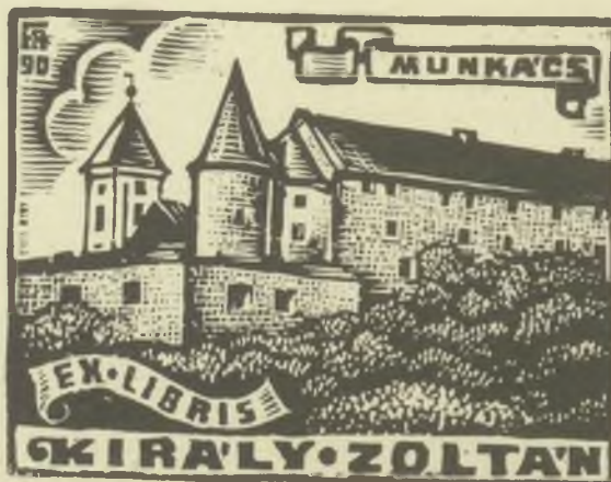
Fery Antal fametszete X2