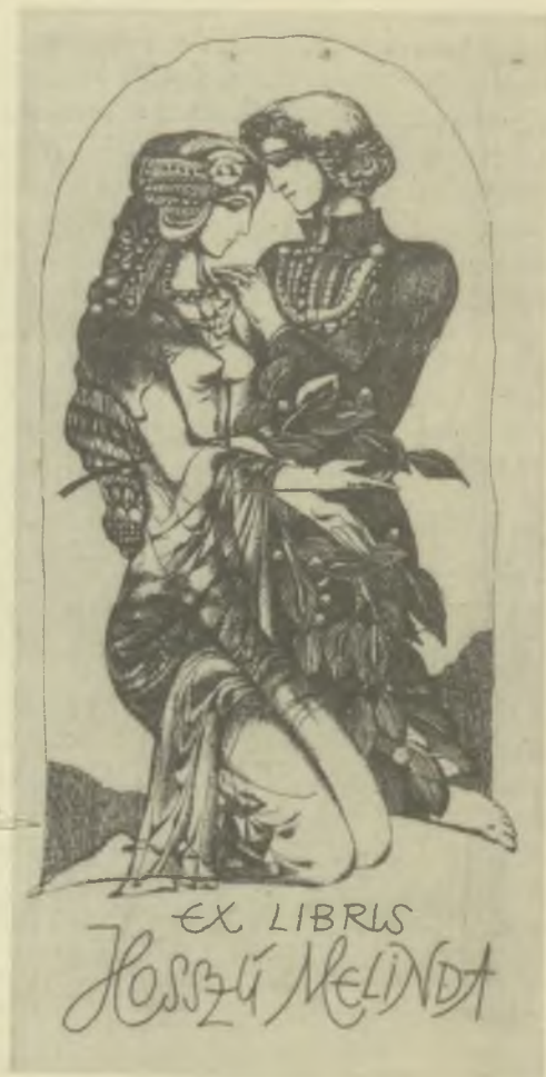
Deák Ferenc rézmetszete C3

Az ex libriseiről is jól ismert kiváló kolozsvári grafikusművész Betű és rajz című (Kriterion, 1989. 220 lap) könyve az idén került a hazai könyvpiacra. Könyvében