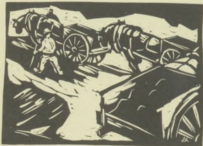
Andruskó Károly linómetszete X3