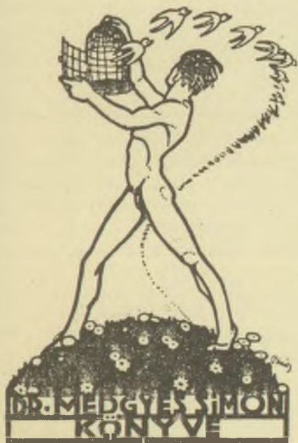
Bíró Mihály litográfiája L

rabjai a szentimentális, álmodozó, szomorkás hölgyek; mint Kozma Lajos figurái, akik örök tétlenségre kárthatva mereven, búsan néznek a messzeségbe. Alakjuk sovány, hajukat egyszerűen hátrafésülik, vagy kontyba fogják össze.