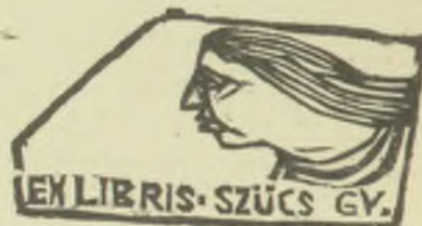
Perei Zoltán metszetei