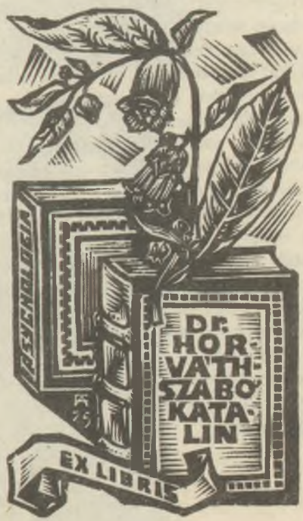
Fery Antal fametszete X2