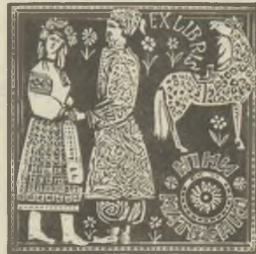
Нy. 1. Sztratilat műanyagmetszetei