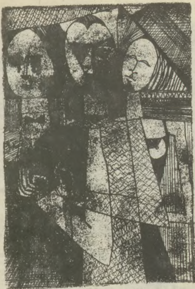
Tellinger István rézkarcai C3