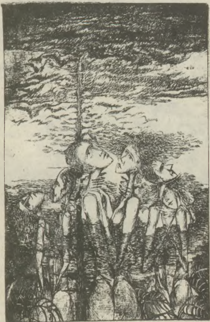
Kamper Lajos rézkarcá C3