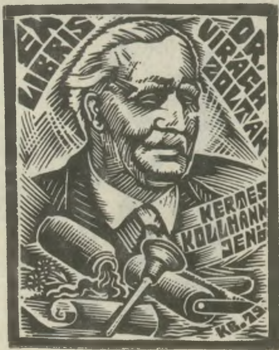
Kósa Bálint metszete X2

Az 1956-ban megalakult Pirckheimer Társaság a fenti címmel jelenteti meg az NDK könyvbarátainak hivatalos lapját. A kiadvány napjainkban évente négyszer, példányonként 120 oldal terjedelemben lát napvilágot. Cikkei főként könyvművészeti kérdésekről szólnak, de az exlibris-élet híreiről, az ilyen kiállításokról is olvashatunk benne. Első száma 1957 januárjában került ki a nyomdából, mindössze 24 lapon. Azóta a lap terjedelme megnőtt, s a sorozatban a mostani szám éppen a századik! A jubileum alkalmából a szerkesztők visszatekintenek a kiadvány közel három évtizedes történetére, mi pedig ezúton kívánunk német barátainknak további eredményes évtizedeket!