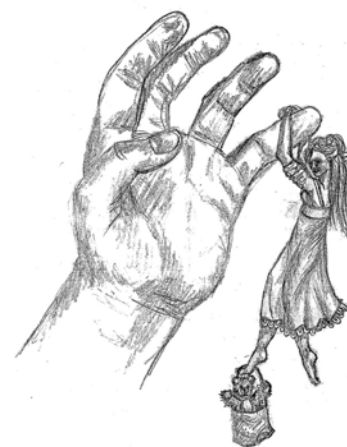
Csáky Zsuzsa rajza