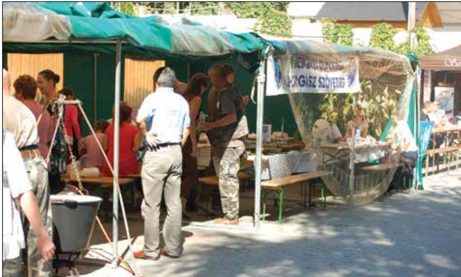
A szövetség sátra korán megtelt vendégekkel