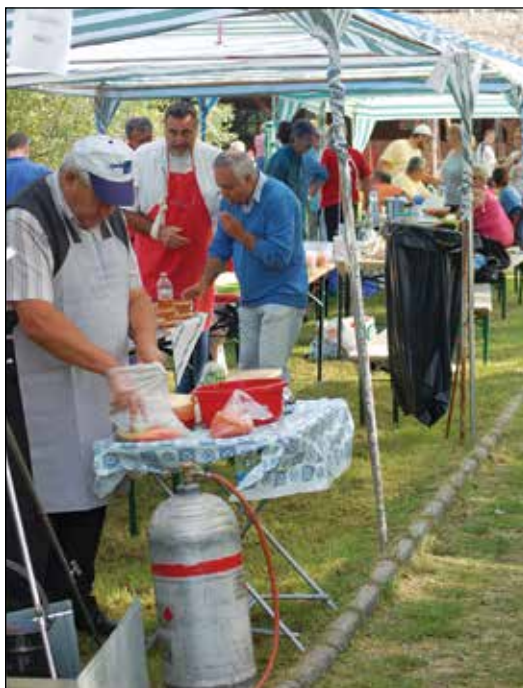
A főzősátrakat korán reggel elfoglalták a versenyzők

de az a szakma hibája, hogy nem képes feldolgozott, konyhakész formában értékesíteni a termékeit. Lévai Ferenc régóta szószólója annak, hogy az ágazat fogjon össze, hozzon létre egy közös halkereskedelmi céget, ahová a tógazdák beszállíthatnák a termékeiket. A szakmának egyben kellene lennie, de a sokféle érdek miatt nem egységesek. Ezért is döntött úgy a vezérgazgató, hogy végvárat épít Rétimajor központtal, ahol a cég érdekeit kell kőkeményen képviselni. Persze az itteni tevékenység kihatással van a magyar halásztársadalom egészére is. A szakmai egység megteremtéséről azonban továbbra sem mond le, s mindjárt egy javaslattal is előállt: Jó volna, ha a tavaszi holt szezonban országosan, a cégek összefogásával megrendeznék a Magyar Hal Napját. Véleménye szerint Budapest jó helyszíne lehetne a rendezvénynek.