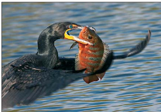
A félkilós halak sincsenek biztonságban

A kárókatona által okozott károk enyhítését célzó intézkedések engedélyezése és finanszírozása a tagállamok, illetve a régiók hatáskörébe tartozik, mivel azonban – költöző madár lévén – a kárókatona-állomány fenntartható kezelése csak valamennyi érintett tagállam és régió összehangolt fellépésével, az Európai Unió segítségével valósítható meg. „Az európai akvakultúra fenntartható fejlődésére vonatkozó stratégia” című bizottsági közlemény „Ritkítás védett fajok által” című szakasza