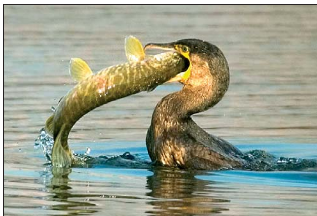
A jó étvágyú, válogatós kormorán

A madárvédelmi irányelv 9. cikke lehetővé teszi a tagállamok és a régiók számára,