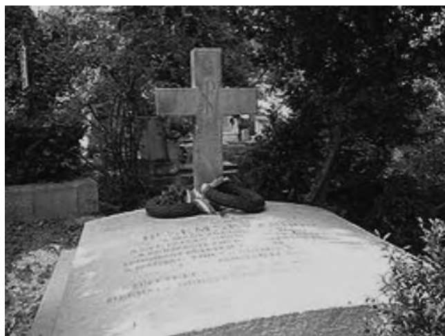
SEMSEY Andor sírja a Farkasréti temetőben

EÖTVÖS Loránd meleg hangú levélben köszöntötte nyolcvanadik születésnapján kedves barátját, az egészségét Tátralomnicon kúráló SEMSEY Andort. Befejezésül idézzük az idős mecénás válaszlevelének egy részletét: „Fogadd őszinte köszönetemet szép és választékos soraidért, amelyeknek melegsége és közvetlensége nekem nagyon jól esett. Az átélt 80 évre visszapillantva érzem, hogy többet is tehettem volna a művelődés és tudományos haladás érdekében; de ki volna képes arra, hogy minden tervét megvalósíthassa. Őszinte örömmel tölt el, hogy törekvéseimet oly kedvesen méltányolod; a derű kedves sugarait árasztod ezzel nyolcvanadik születésnapomra. Itt a főséges Tátra aljában szememet és beteg testemet ápolgatva töltöm időmet. Lelki gyönyörűséggel kísérem a modern természettudományok haladásának egy-egy fázisát...”