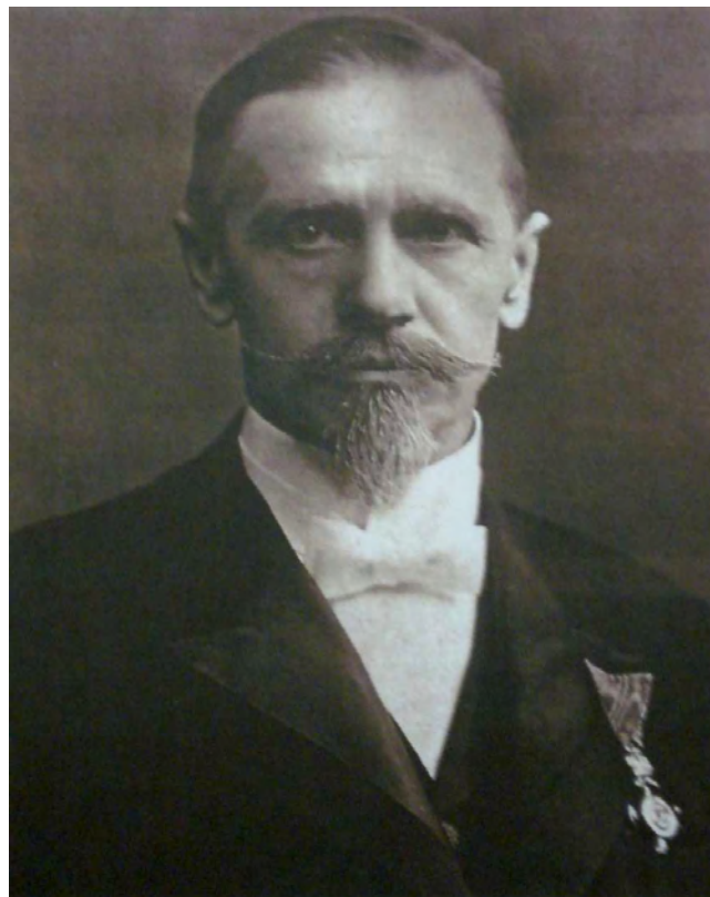
Süss Nándor (1848–1921)

települt át Magyarországra, ahol megbízták az akkor létesített Egyetemi Mechanikusi Állomás vezetésével. SÜSS Nándor magával hozta gépeit berendezéseit. Feladatává tették, hogy az oktatáshoz szükséges műszerek és berendezések megépítésén túlmenően kinevelje saját munkatársait is. Műhelye gyártmányaival és javításaival hamarosan országos hírnévre tett szert. Olyannyira, hogy 1884-ben BAROSS Gábor, a későbbi neves közmunka és közlekedésügyi miniszter, ekkor még csak államtitkár, aki a szakképzés megszervezésére különös hangsúlyt helyezett, EÖTVÖS Loránd javaslatára kezdeményezte, hogy a kormány Budapestre rendelje és bízza meg egy mechanikai tanműhely felállításával.