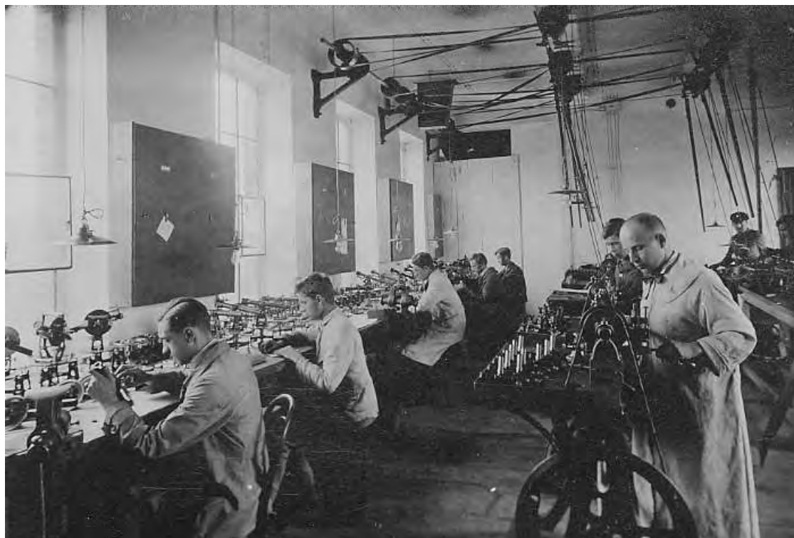
Geodéziai műszerek szerelése a Süss-gyár műhelyében az 1920-as években