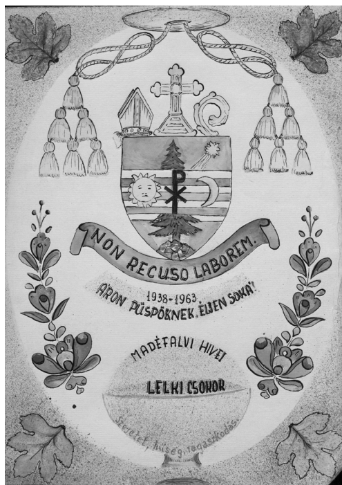
Madéfalvi hívek lelki csokra, 1963.