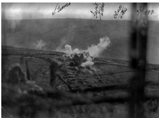
A 16. szakasz bombázása