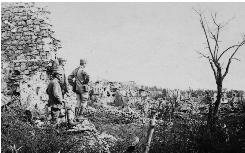
San Martino, 1916 márciusa