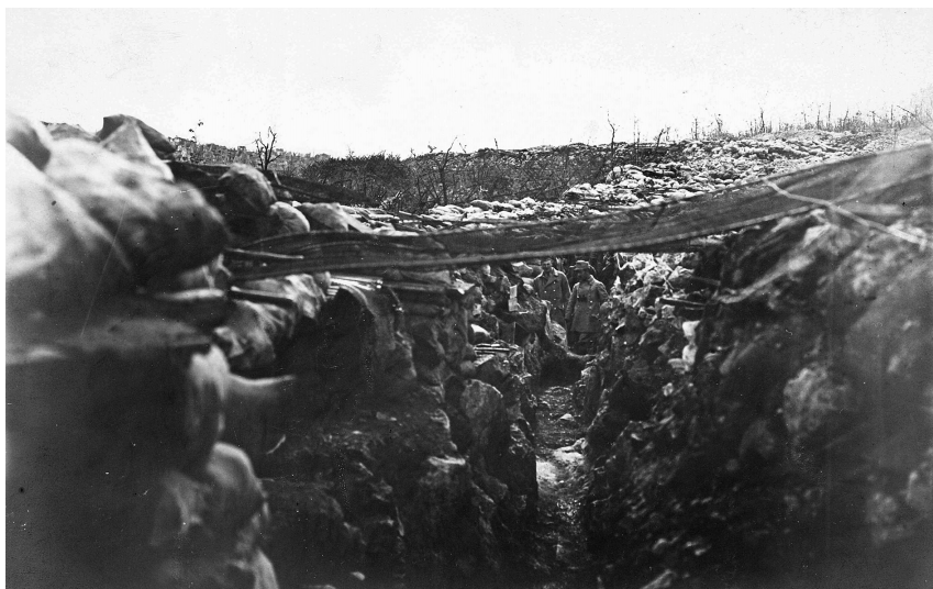
Lövészárok, a 18. szakasz