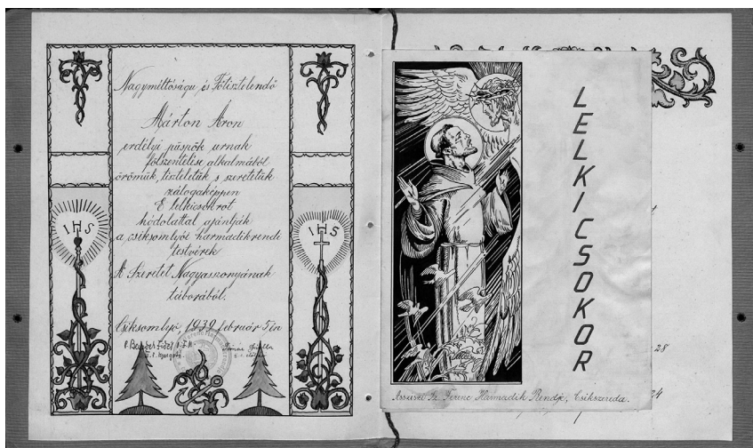
Csiksomlyói harmadrendi testvérek lelkicsokra, 1939.