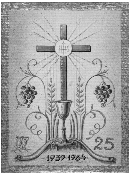
Maroshévízi hívek lelkicsokra, 1964.

Vita nem volt, te csak mentél, én pedig szórok rá kis sajtot, szerecsendiót. Tulajdonképp egészen jól sikerült. Ölemben a lábossal ülök most itt, az ágyon, megeszem a csilis babot mind, még akkor is, ha több mint hét év.