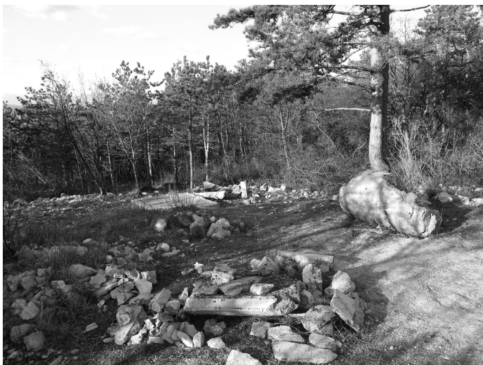
A bresciai katonai alakulat elpusztított emlékműve

Dunaföldváron megállunk, két tábla van a városháza falán. Az első Petőfi (valakik elhelyezték nála az emlékezés koszorúit). A másik a Mohács felé tartó magyar hadsereg emlékműve . Ja tényleg. Milyen szerencse, hogy van ilyen is. Rohamosan épül a mai kor, ennek is lesz emlékműve egyszer.