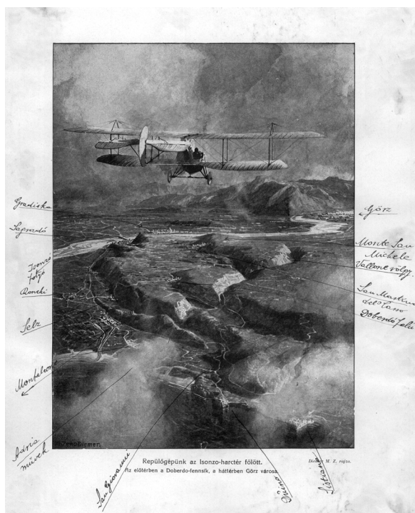
A Doberdói-fennsík felülnézetből

luma értelmet ad az elszenvedett sérelmeknek, a szenvedésnek, a halálnak, az írósnak, úgy a Gyász a számvetés szövege, amelyben az após alakjában összegződnek a lét alapvető fogalmai és kérdései, benne összeér a kezdet és a vég, a végben feltárul a kezdet, a bejárat emberi-alkotói út fájdalmas-kínos szépsége, ami egyben az esztétikum, az irodalom jutalma: „(...) életem kiemelt pillanatainál találkozásunk óta jelen van. (...) szülni is csak apósom kísér el, s ezt életünket megpecsételő ómennek látom: jóllétünket áldozzuk fel a jólétért.” Lehet-e egyéb feladata az irodalomnak, mint szépséggé lényegítse, mi rút, és időtlenné esztétizálja a mulandót? Lehet-e nagyobb elégtétele alkotónak és befogadónak, mint az, hogy az alkotás és az olvasás során megtapasztalja a költői szónak ezt az átlényegítő erejét? Vajda Anna Noémi elégedett lehet. Az olvasó a Hámozottakat becsukva úgyszintén.