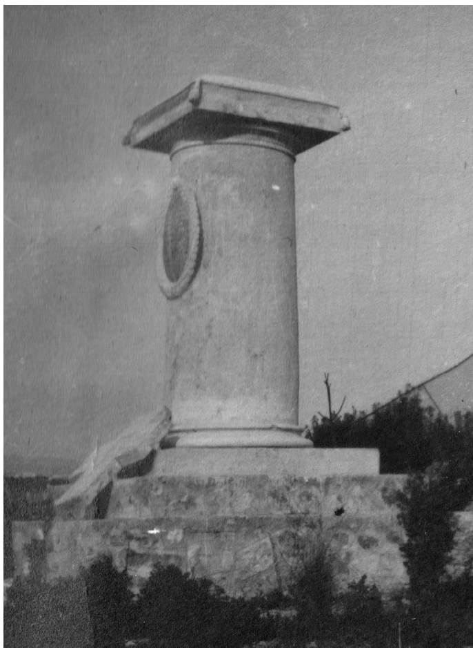
Az 1916-os bresciai katonai alakulat emlékműve

abbahagyni a szerelmeskedést, úgy tűnt, sose lesznek hajnalok, csak egymásba kapaszkodó éjszakák, féktelen ölelések és hideg, téli csillagok.