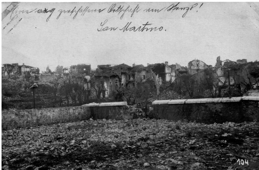
A San Martinói víztároló