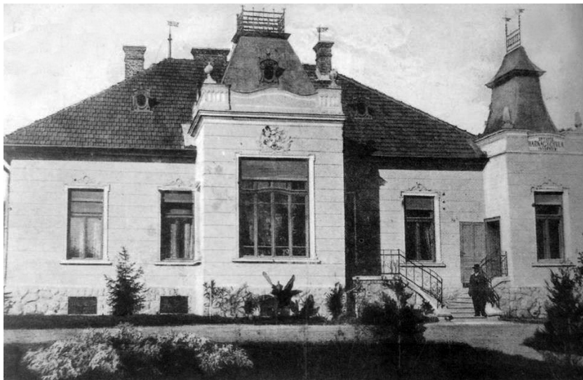
Hadnagy Gyula villája, Dálnok

töltött időszakáról, mindkét esetben azzal a szándékkal, hogy közlésük esetén küldjenek számára vissza egy-egy példányt a frontra, emlékül.