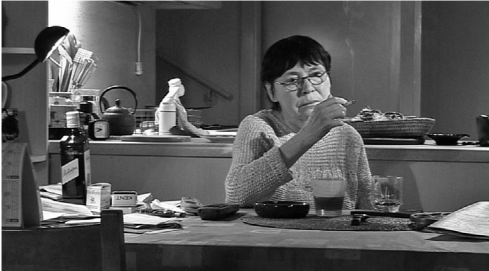
Neuchâtel-i otthonában

mellett, a háború, a deportálások, majd a szovjet csapatok bejövetele után, a szögesdrótos vasfüggöny korában vagyunk. Persze, nekünk kőszegieknél – olvasva a regényt – pillanatra sem kétséges, hogy gyermekkori emlékei elevenednek meg a fiktív és valós történetekben. Van benne egy villanásnyi holokauszt is, amelynek valóságalapja van a város, K, vagyis Kőszeg történetében.