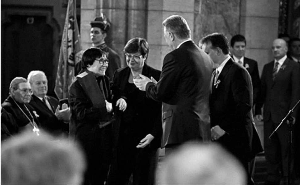
A Kossuth-díj átvétele a Parlamentben, 2011