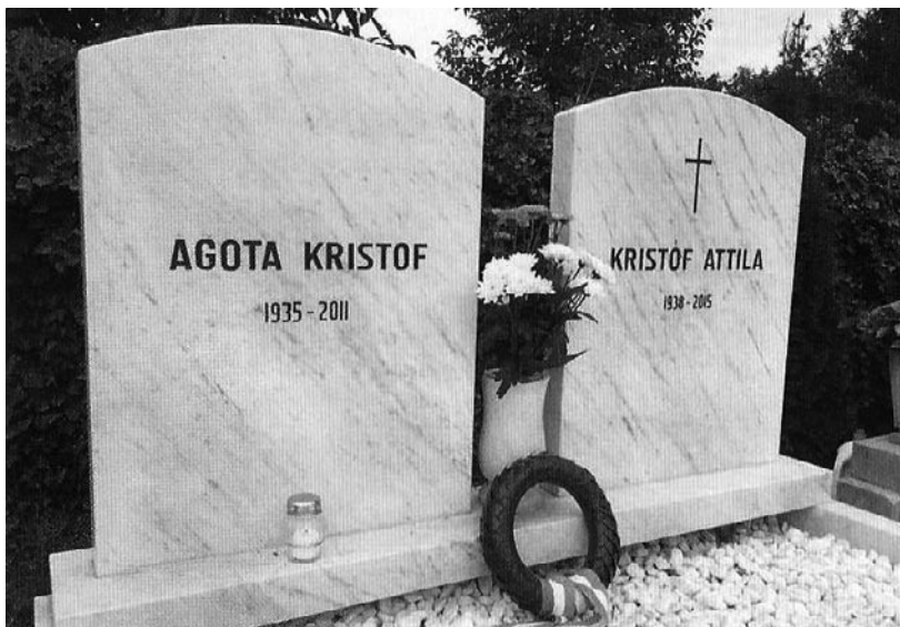
Síremlék a kőszegi városi temetőben (Fotó: Németh Iván, 2019)