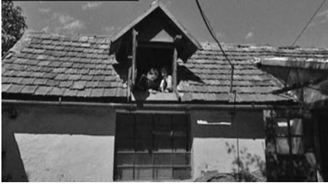
„Nagyanya háza” a Róti völgyben, 1997

nem ő uralja fölényesen. „És van még egy ok, amiért így hívom – mondja –, és ez az utóbbi a súlyosabb: ez a nyelv az, amelyik folyamatosan gyilkolja az anyanyelvemet.”