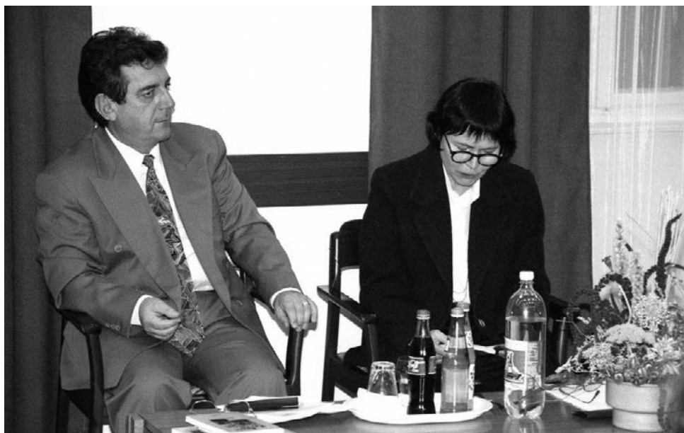
Az első felolvasóest. Chernel Kálmán Városi Könyvtár, 1994. október 27.

regény, mi magyarok vagyunk képesek felismerni a magyar tájat, a nyugati kisvárost, K-t, tudjuk kik azok az „azok”, tudjuk kik ülnek a Forradalmi Párt Titkársága feliratú ajtó mögötti irodában.