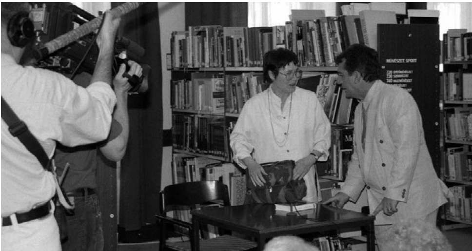
A második felolvasóest Kőszegen, 1997. június 13.

Jártam a MÁV Szombathelyi Területi Igazgatóságán a területén készítendő felvételekhez engedélyért, előre megbeszéltem a rendőrséggel az utcai forgatásokhoz a forgalom elterelését, az útlezárásokat. Beszéltem a régi szomszédokkal, értesítettem az osztálytársakat, kisbuszt béreltem. Ezzel mentem Sopronba a GYSEV-állomásra, ahová a svájci vonat megérkezett. Ágota ezen az útvonalon járt haza. Az üdvözlés után azonnal forgattak a pályaudvaron. Az Írottkö szállodában foglaltam nekik szállást. Másnap a stáb egy kis pihenőt tartott. Eric az operatőrrel két fiút keresett az ikrek megszemélyesítéséhez.