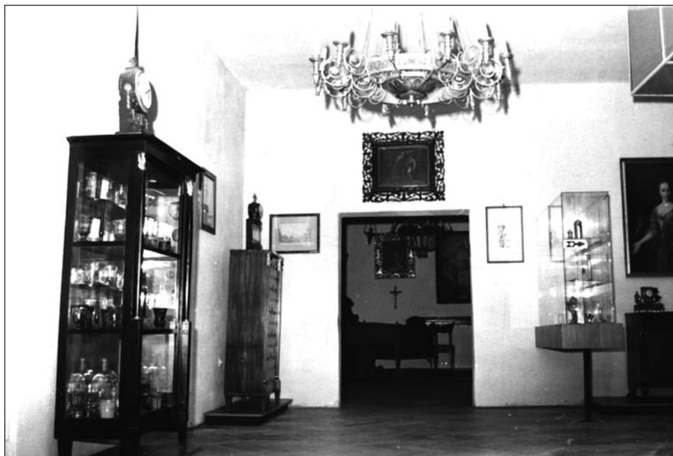
2. kép: A Smidt Múzeum első, állandó kiállításáról – empire szobájából a barokk terem felé – készített felvétel