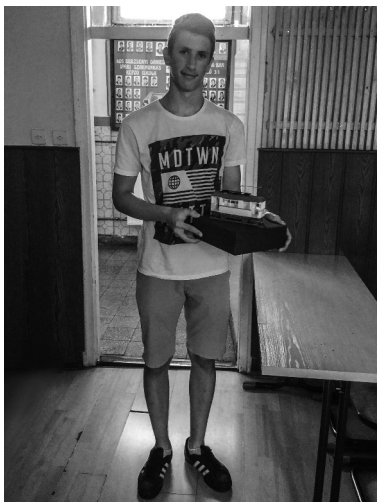
5. kép. „...álmában csönget egy picit...” A 3D-s makett és alkotója

életében milyen szerepet játszott a politika. A helytörténeti témák feldolgozását játékos feladatok, tesztek, szituációs gyakorlatok színesítik. Az első megyei napilaphoz kapcsolódó foglalkozáson a korabeli újságok híreit sms-ben kellett összefoglalni, az első telefonkísér-