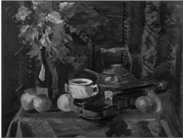
Hegedűs csendélet (1998, o.v., 60x80 cm)

Festőművészete a portréktól, a csendéleteken és városi vedutákon át a tájképekig terjed. Utóbbiakat laza ecsetkezeléssel, oldott, könnyed színhasználattal valósítja meg. Az élet, a