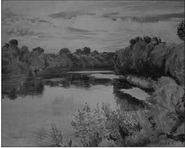
Jándi Tisza-kanyar (O.V. 80 x 100 cm 2015.)

Külön egységet képez munkásságában a Dalmáciában készült műveinek sorozata. A dús vegetációjú mediterrán táj, a hangulatos tengeröblök, városrészletek, az Adria tenger azúrkék vize mind-mind olyan témák, amelyek a mester ecsete által ihletett módon kerültek megörökítésre. Barátja, Molnár Károly hívására, mintegy egy évtizeden át évről-évre rendszeresen visszatért Közép-Dalmácia legnagyobb szigetére, Hvarra, ahol Jelsa városában, illetve a környé-