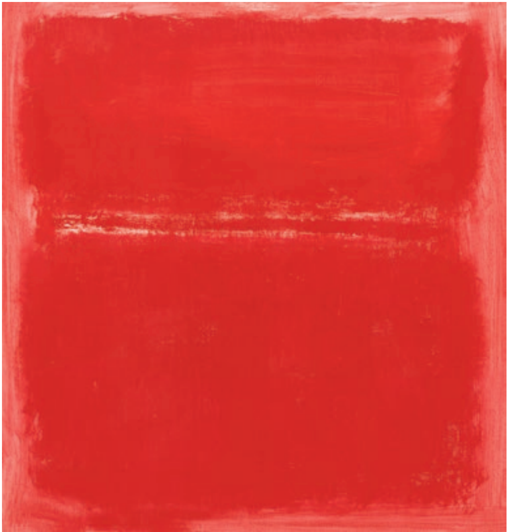
Mark Rothko: Cím nélkül , 1970 National Gallery of Art, Washington D. C.