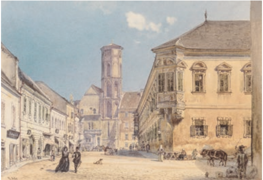
Rudolf von Alt: A Mátyás-templom Budán, 1845 k.