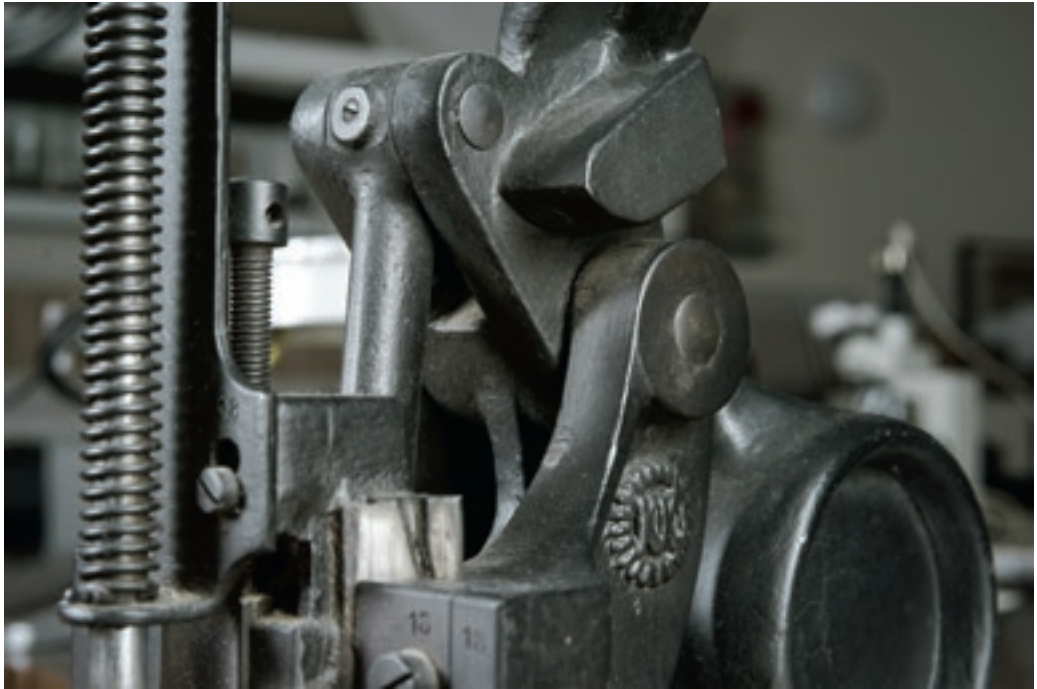
Eszköz a restaurátorműhely korai időszakából