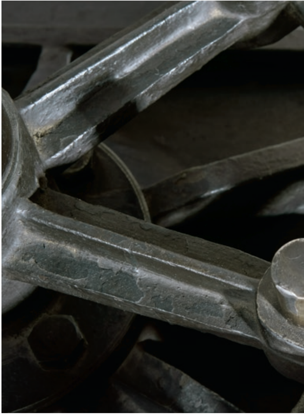
Észköz a restaurátorműhely korai időszakából