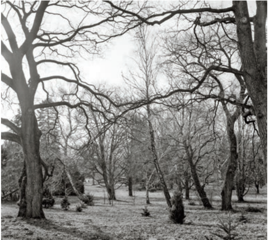
Az alkotóház parkja 1965-ben