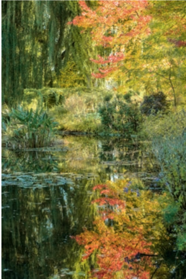
Claude Monet kertje Givernyben