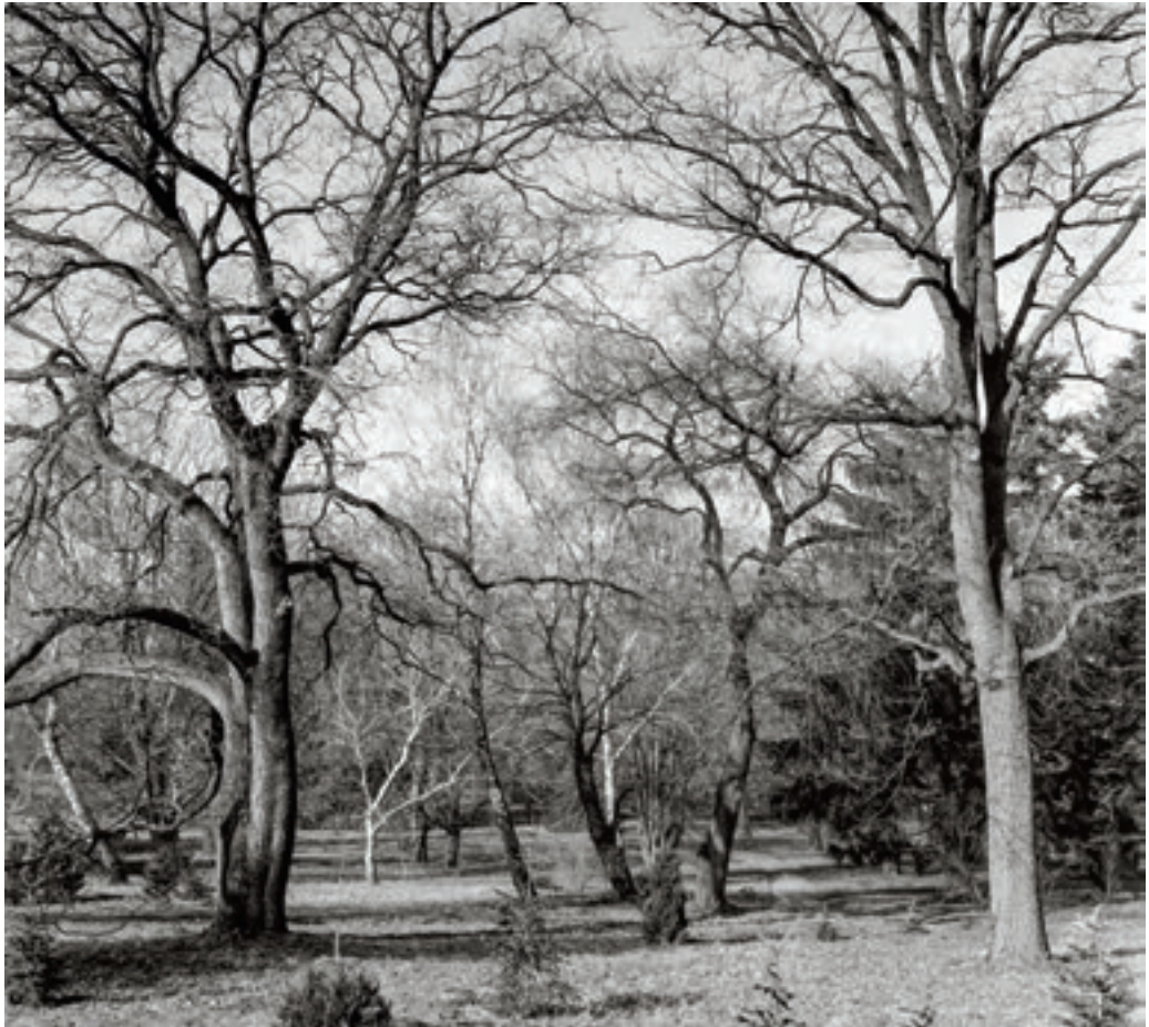
Az alkotóház parkja 1965-ben