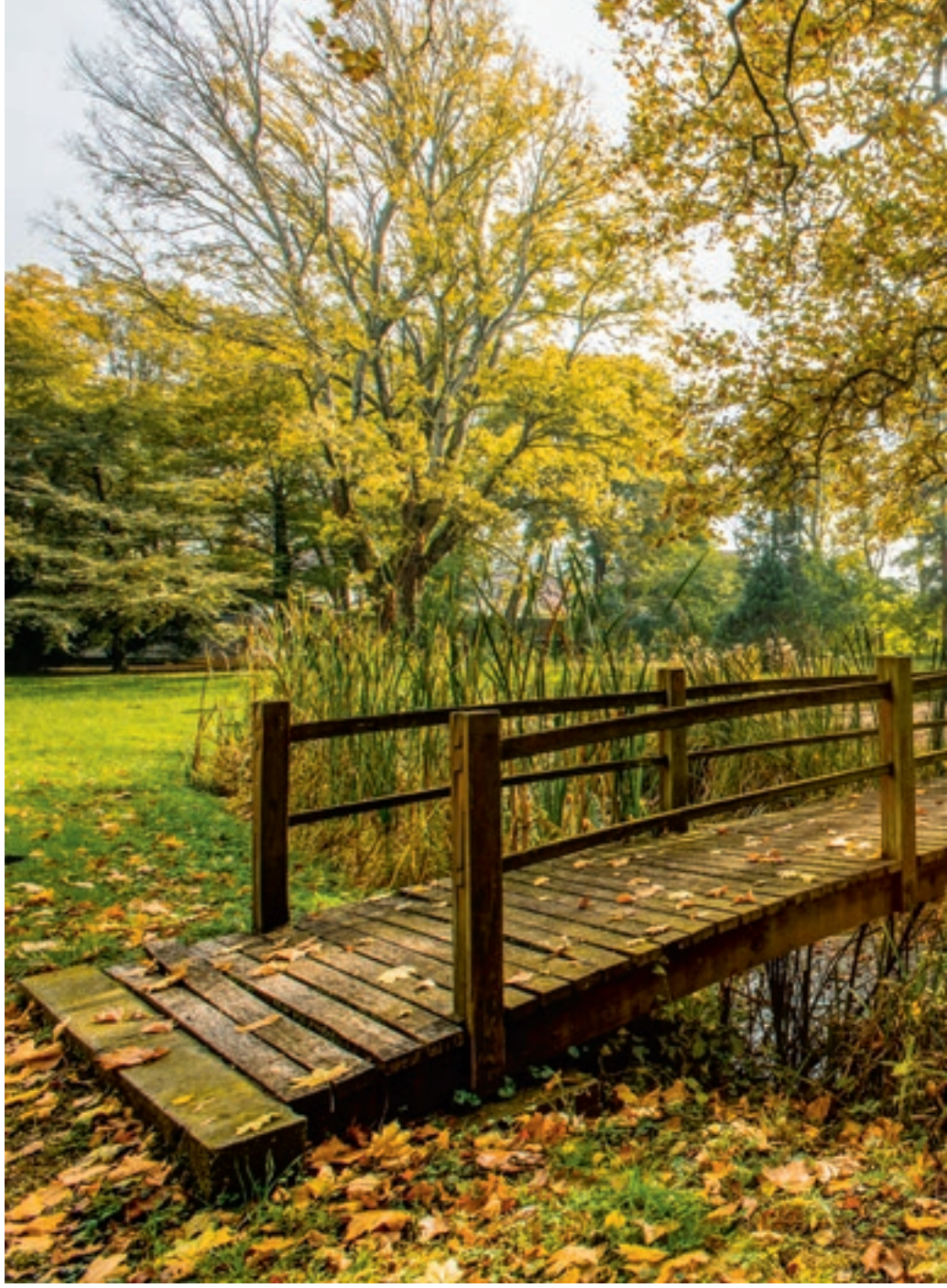
Az arborétum részlete a mesterséges tóval és a hiddal