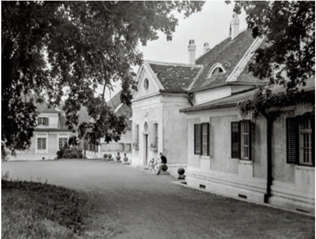
Az Esterházy-kastély 1949-ben