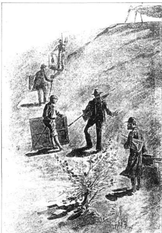
A kendereskei magaslatokon (Ujváry Ignác rajza)

„Egyetlen nép, egyetlen nemzet sem bízhat a jövőjében, ha nem ismeri, nem becsüli meg a múltját, történelmét, annak nagy alakjait. S ehhez nem elegendő a történettudomány a maga élve boncoló, hideg-rideg tárgyilagosságával, úgynevezett „kristálytisza” logikájával. Ehhez alkotó néplélek, egyfajta nemzeti lélek is kell, mely a legkedvesebb, legcsodáltabb hőseinek alakját legendává magasztosítja, meséivel övezil