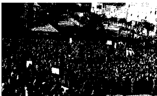
A nagygyűlés hallgatósága

Az előbbieknél jóval nagyobb munkát igényelt a községi tanácsok megszervezése. Ezen belül is az új hivatali szervezetű községek apparátusának kialakítása és elhelyezése jelentette az első feladatot. Zala megye akkor 260 községében összesen 223 tanács alakult, ebből 191 volt az önálló és 32 a közös ta-