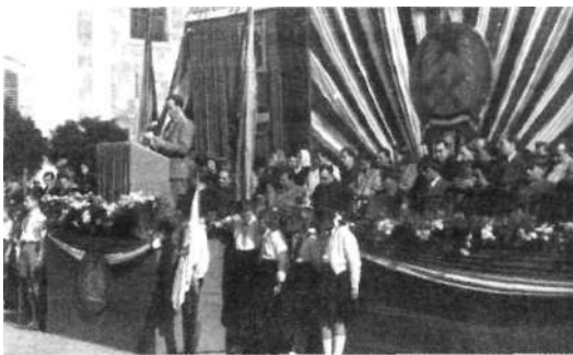
Választási nagygyűlés Zalaegerszegen (1950)

Kezdetben még próbálták kiküszöbölni a születő rendszerből az emberek többségének körében baljós emlékü Tanácsköztársaság kapcsán legalább a tanács szót, néphatóság, népi bizottság elnevezésekkel helyettesítve azt, de 1949 közepére már alábbhagyott