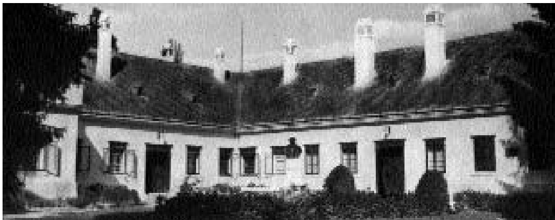
A kúria udvara a Deák-szoborral az 1950-as években

A kúria hasznosítása azonban nem sokáig maradt meg méltó a legnevesebb tulajdonos, Deák Ferenc emlékéhez. 1910. április 7-én Károlyi Imre gróf, nagymágocsi birtokos vette meg, 1925. október 30-án pedig továbbadta a magyar államkincstárnak, egészen pontosan a belügyminisztérium által felügyelt Kivándorlási Alapnak. Attól ugyanazon év december elsejével a Földművelésügyi Minisztérium vette bérbe a birtokot,