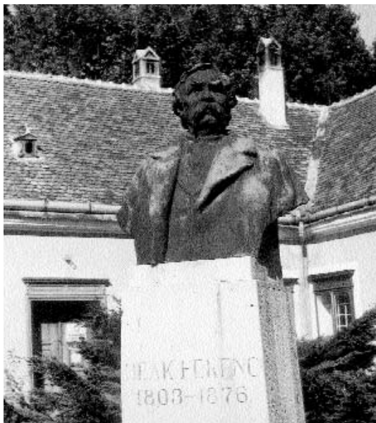
Zala György alkotása, Deák Ferenc mellszobra a kúria udvarán

hektáros, védett parkkal övezett kúria déli udvarán áll Zala György szobrászművész 1928. október 14-én felavatott alkotása, Deák Ferenc bronz mellszobra, mely Deák időkori arcvonásait örökíti meg. A szobor hasáb alakú, fehér márvány talapzatán Deák Ferenc neve és születési, illetve halálozási évszáma alatt az alábbi idézet olvasható: „Minden jó hazafinak naponként reggel s esteli imádsága: Isten áldja meg a hazát”.