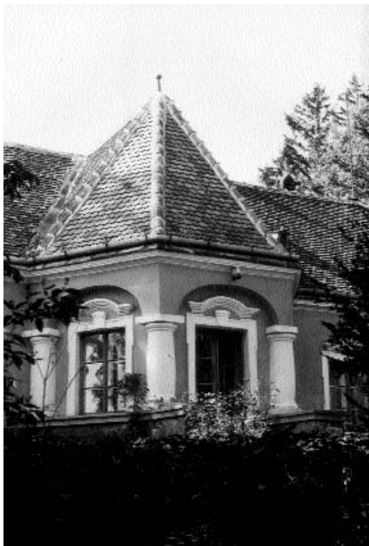
A keleti homlokzat a Baronyi-testvérek által építtetett új főbejárattal

1847 februárjában a pártta szerveződő liberális ellenzék vezetői keresték fel Kehidán Deákot, hogy hoz-