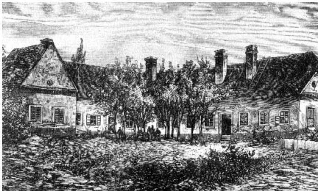
A kúria első ismert ábrázolása 1876-ból, Deák Ferenc halálának évéből

Az épület keleti szárnyának déli sarkán „Deák Ferenc emlékére 1803–1876” feliratú vörösmárvány tábla idézi az egykori tulajdonost. A mintegy másfél