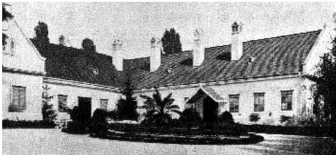
Ilyennek láthatta a kúriát Eötvös József 1905-ban

Gyászos emlékű esemény történt Kehidán 1843 áprilisában is. Zala megye április 4-ei zalaegerszegi közgyűlésén a felheccelt és leitatott kortések leszavazták a nemesi adófizetés bevezetésének tervét, és lehetetlenné tették Deák Ferenc számára, hogy elvállalja Zala országgyűlési képviselőt. A győzelemittas, adózást ellenző büki, vitai, köszvényesi és Rezibe való kisnemesek aznap este, útban hazafelé, Kehidán rátámadtak a közellenségnek kikiáltott Deák Ferenc kúriájára. Így örökítette meg az esetet Huszár János, Deák kehidai kasznárja: „Az estve nyolc és kilenc óra között mintegy