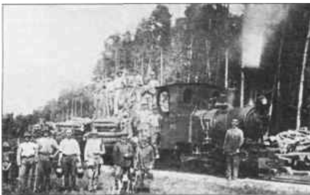
Rönkszállítás a zajdai erdőből 1931-ben

Különbféle kiadványok szerkesztői időről-időre kerestek lentiről történeti anyagokat, de ez nem állt rendelkezésre. Annyit lehetett tudni, hogy a korai mezőváros a Bánffyak birtoka volt, és hogy mint török elleni végvár helyt állt. Összegző történeti anyag nem volt. A kilencvenes évek elején felkértek, hogy írjam meg a helység középkori történetét. Így jelent meg 1993-ban az első rész.