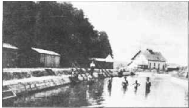
Strandfürdő a Kerkán a 30-as években

megteremtették az ipar kialakulásának feltételeit. Lenti fejlődésében fordulópontot hozott, a más összefüggésében tragikus trianoni szerződés. Az Alsólendvai járás székhelye Lendva Jugoszláviához került, a székhely nélkül maradt csonka járás központjává Lentit választották, és 1925-től megkezdte működését a Főszolgabírói Hivatal. Valószínűleg befolyásolta a döntést, hogy herceg