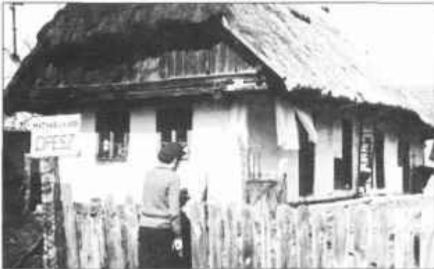
Zsúpos boronaház a XIX. század végéről

Kézbe vettem a könyvet és a címben feltett kérdésre kerestem a választ. Ma, amikor a magyar lakosság lassú, de szinte megállíthatatlan fogyását hallunk, olvasunk nap, mint nap, jó volt szembesülni azzal, hogy Lenti lakossága 1870 és 1900 között, harminc év alatt 46%-kal, a század fordulótól 1949-ig 108%-kal, a nyolcvan év alatt több mint háromszorosára gyarapodott. Érdekesség,