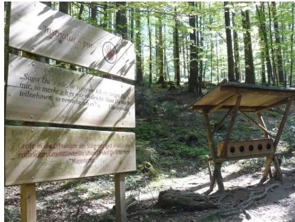
2. ábra (a) Kelten-Baum-Weg (Ausztria) egy állomása; (b) Berg-Wald-Erlebnis-Pfad (Németország) egy állomása

Magyarországon már a kiválasztás során több nehézség merült fel, mint a nemzetközi élményösvények esetében, hiszen az elnevezésekből nem tudtunk kiindulni. Nálunk az élményösvény elnevezést egyelőre kevés létesítmény használja, így a tanösvények között kellett keresni olyan objektumokat, amelyek a leírás alapján rendelkezhetnek interaktív és szenzoros elemekkel is, vagyis teljesíthetik az élményösvény kritériumait. Külön figyelmet szenteltünk a díjnyertes létesítményeknek. A lehetséges helyszínek közé így bekerültek a tanösvények, körutak, ökoparkok, meseösvények és a lombkorona-ösvények is, amelyeket előzetes terepi bejárások során, valamint létesítő-fenntartó szervezetek ill. tervező cégek honlapjain keresztül tudtunk kiválasztani. Az eddig felkeresett kilenc helyszín közül nyolc esetében olyan ösvényeket találtunk, amelyek legalább részben teljesítik az élményösvények kritériumait, vagyis ezidáig 11 %-os hibával dolgoztunk. A felkeresett élményösvények közül összes jellemzőjét tekintve