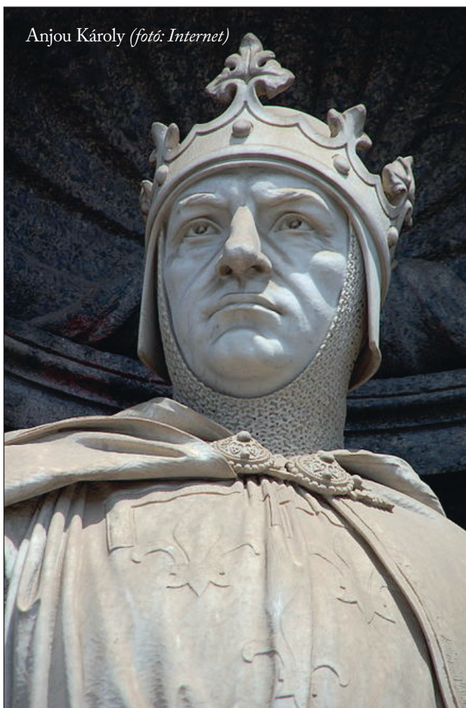
Anjou Károly

Károly emberei felfedezték, hogy a német lemezpikkelyes páncélruha hónaljban nem védi meg a viselőjét a támadásoktól, így ide irányzott szúrásokkal leölték a német zsoldoskatonákat.