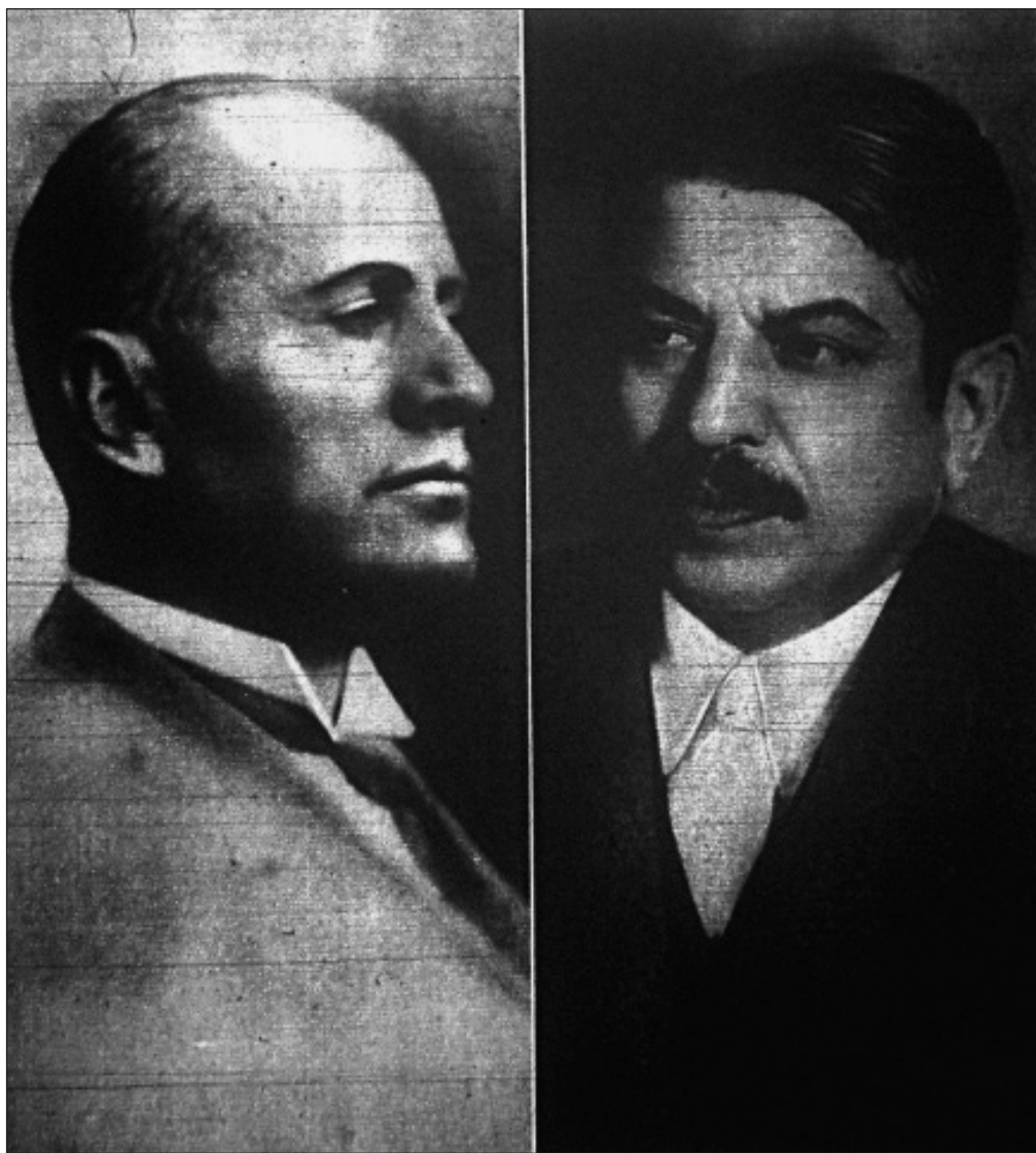
Mussolini és Laval (1935)

Visszatérve a már említett szerződésekhöz (1935.) Egyértelmű, hogy Németország ellen irányultak. Míután a francia képviselőház 1936. február 27-én ratifikálta, jóváhagyta a francia-szovjet egyezményt, a szerződés francia ellenzői is úgy érveltek, ahogy Hitler: ez megsérti a locarnói egyezményt.