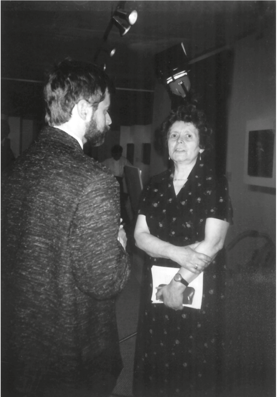
3. Wilhelmb Gizella az Erzsébet, a magyarok királynéja című kiállítás megnyitóján Kismartonban, 1991. június 25-én