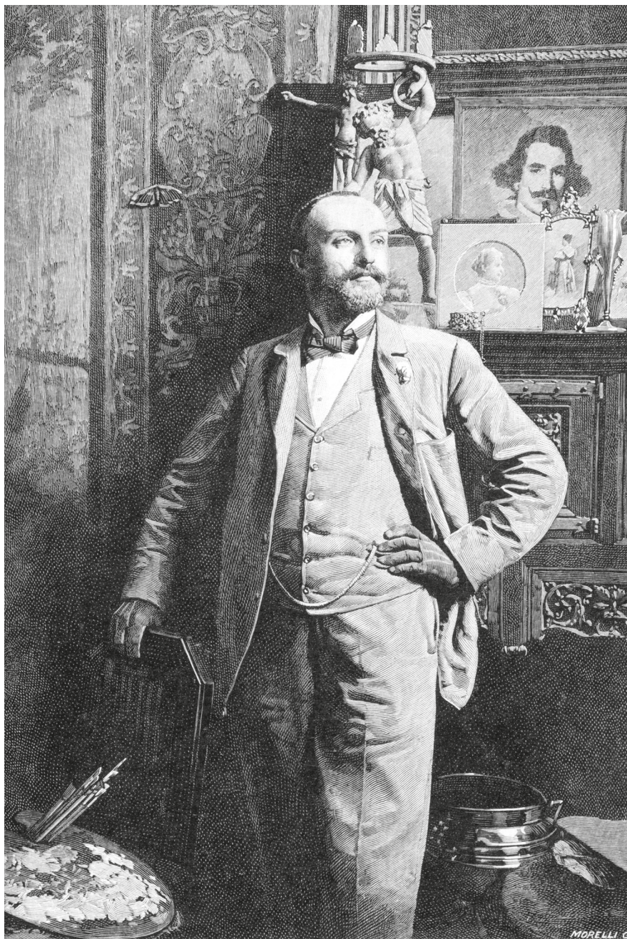
3. Morelli Gusztáv: Koronghi Lippich Elek arcképe, 1901. Papír, fametszet, 161 × 114 mm. Szépművészeti Múzeum–Magyar Nemzeti Galéria, ltsz. 1901-1.