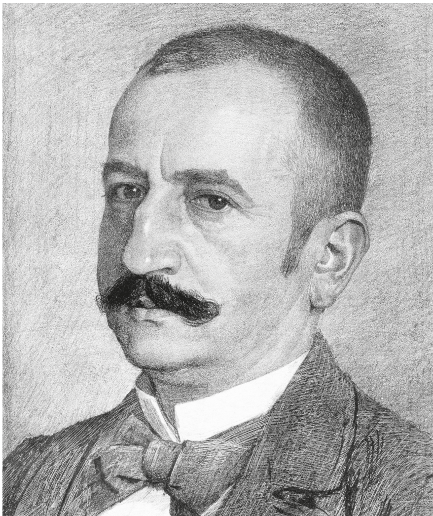
2. Paczka Ferencné Wagner Cornelia: Kammerer Ernő, 1900. Papír, litográfia, 355 × 285 mm. Szépművészeti Múzeum–Magyar Nemzeti Galéria, ltsz. 1900-115. © Szépművészeti Múzeum–Magyar Nemzeti Galéria, Budapest

A várakozásában csalódott és elkeseredett Térey fejében a távozás gondolata is megfordult, s segítségért a berlini képtár igazgatójához, Wilhelm von Bodéhoz folyamodott: „Ez az eljárás számomra annál is inkább kínos volt, mivel annakidején olyan feltétellel jöttem Magyarországra, hogy a Pulszky-affér lezárása után, ha nem is engem, de mindenképpen szakembert bíznak meg az intézet vezetésével – ez olyasmi, ami Németországban, a német felfogás és szemlélet szerint teljesen magától értetődő volna.” 12