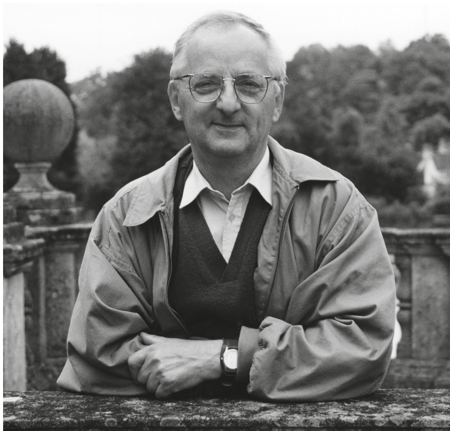
5. „Palladio hídján”. Prior Park, Bath, Somerset, Anglia, 2000.

Ezt követően önállóan többé nem rendezett kiállítást, de közreműködőként és tudományos tanácsadóként később is fontos tárlatok létrejöttében vett részt: Történelem-kép. Szemelvények múlt és művészet kapcsolatából Magyarországon (2000); Mariaszell és Magyarország. Egy zarándokhely emlékezete (2004); Mátyás király öröksége (2008); Ige-idők. A reformáció 500 éve (2019). Mindegyik katalógusba írt egy-egy nagy tanulmányt is.