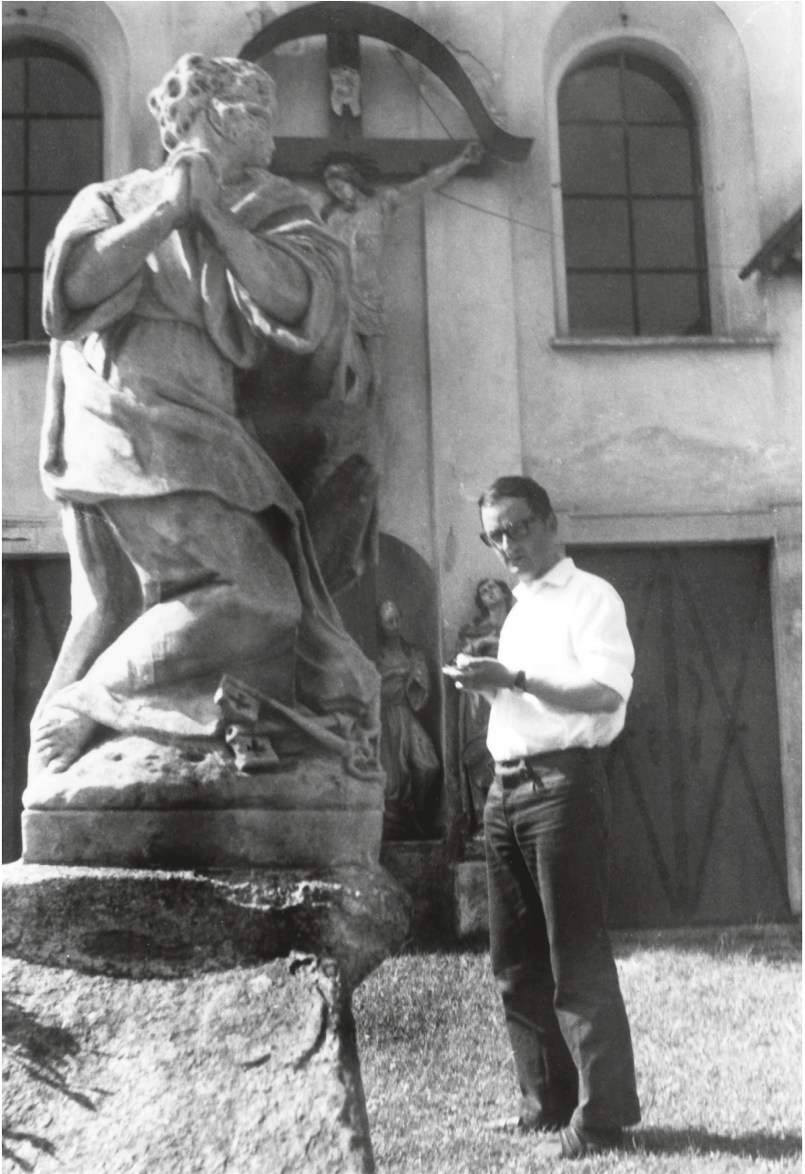
2. Galavics Géza a kőszegi Kálvária előtt, 1970-es évek.