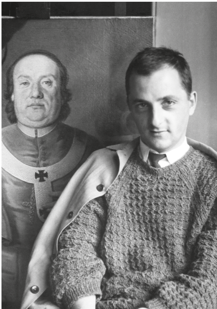
1. Galavics Géza Barkóczy Ferenc érsek portréja előtt a Magyar Nemzeti Múzeum Történelmi Képcsarnokában, 1965 körül.