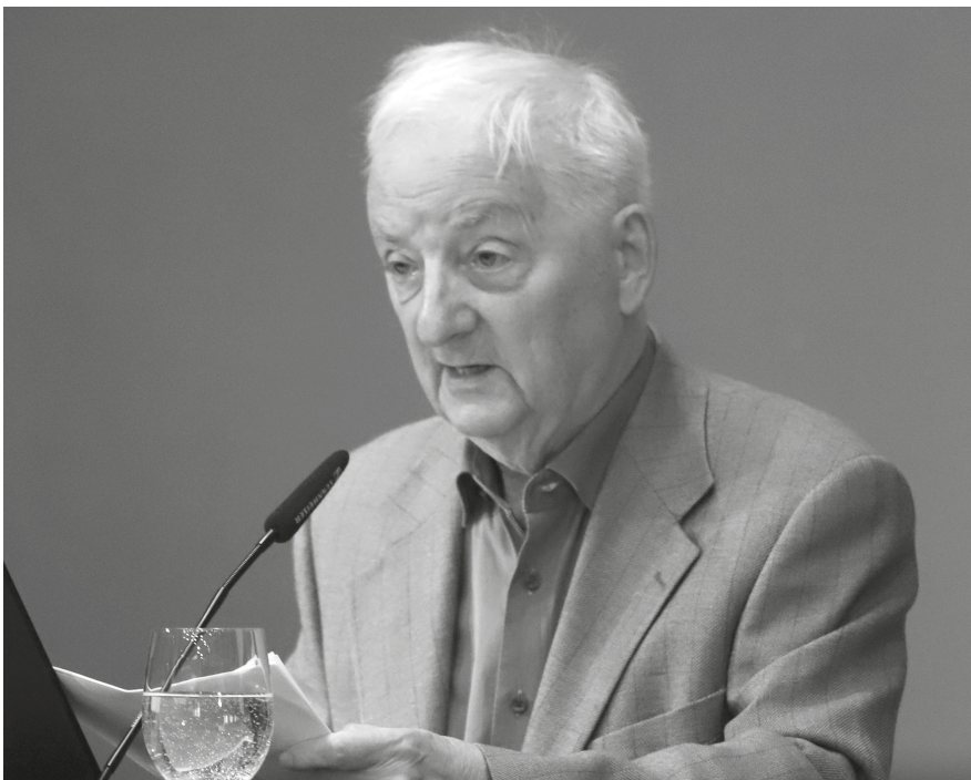
7. Galavics Géza az MTA rendes tagja székkfoglaló előadását tartja, 2022.