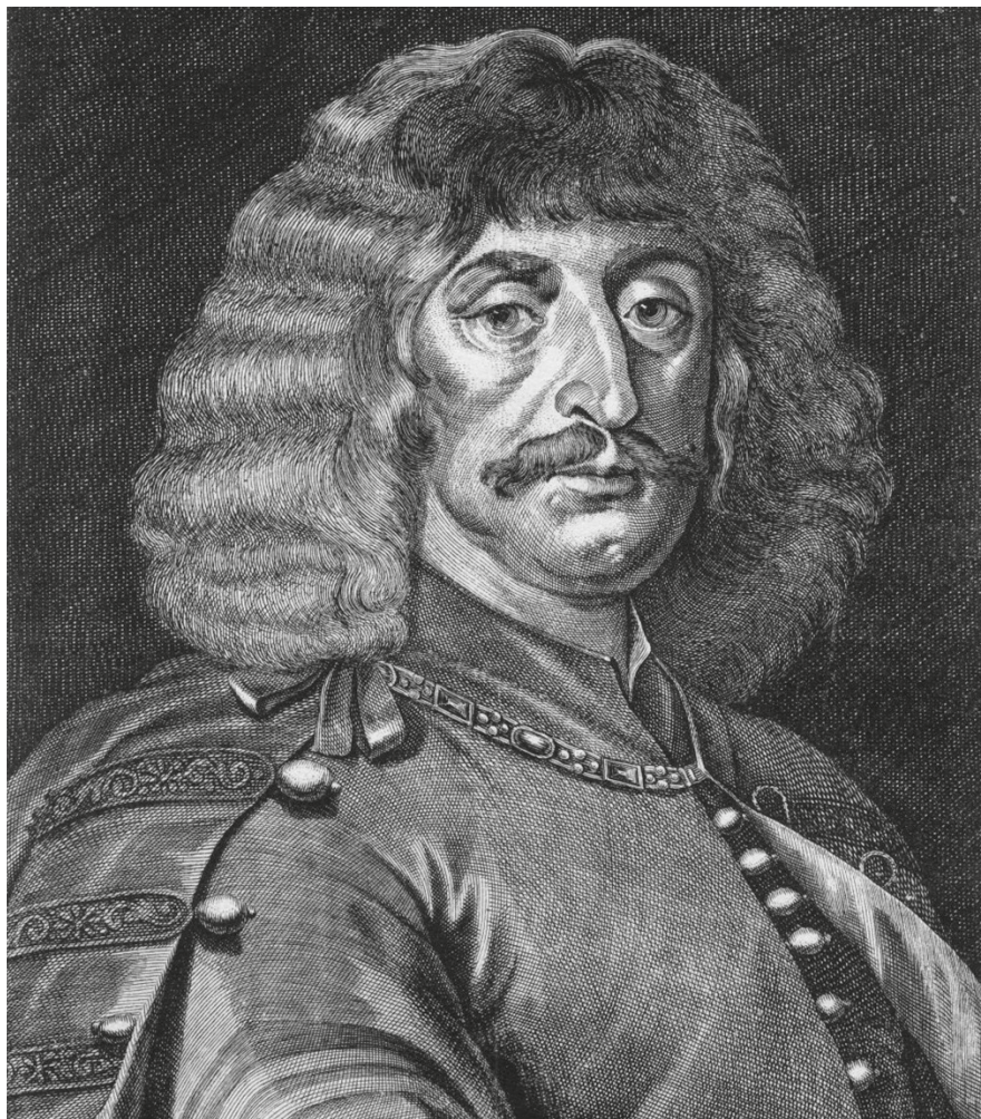
4. Gerard Bouttats (Jan Thomas nyomán): Zrínyi Miklós képmása, 1664. Papír, rézmet-szet, 33,3 × 23,7 cm.

és mentében ábrázolja a költőt, jobbában hadvezéri tevékenységének jelképeként tollas buzogányt tart.