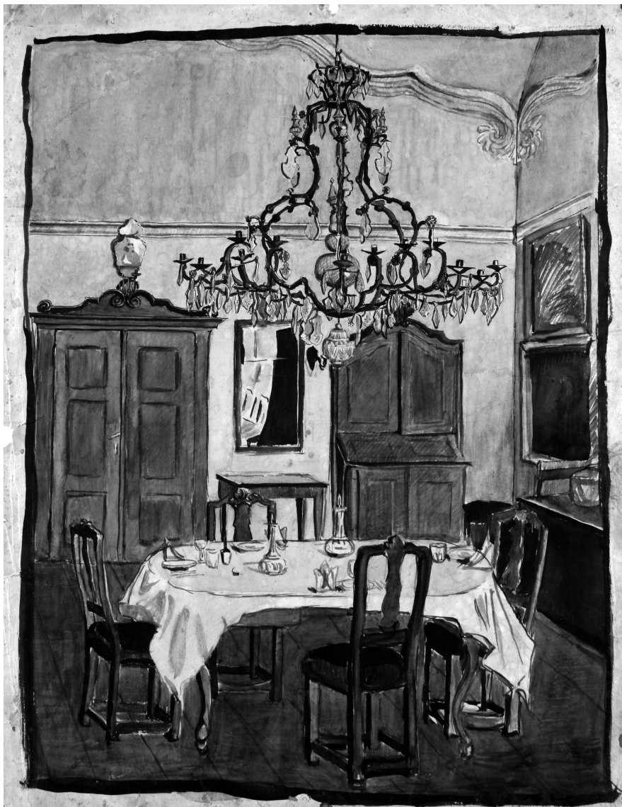
4. Czóbel Margit: A nagyőri kastély, enteriőr. 1930–1950 között.