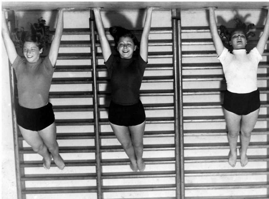
André Kertész: Hárman a bordásfalon (Szentpál-táncosnők), 1935.