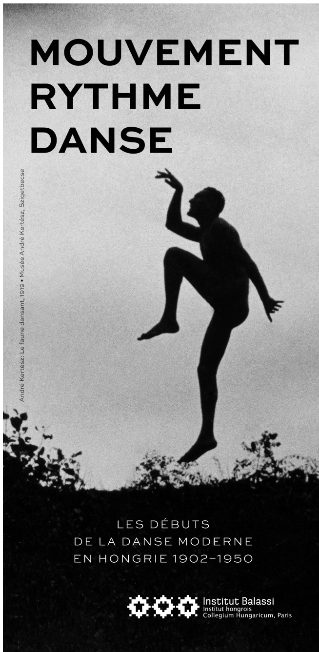
A párizsi Magyar Intézet mozdulatművészeti kiállításának plakátja, Fákó Árpád munkája