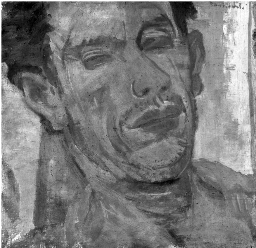
Derkovits Gyula: Önarckép, 1934. Olaj, vászon kartonon, 42,2 x 43,2. MNG ltsz.: F.K. 10.335.