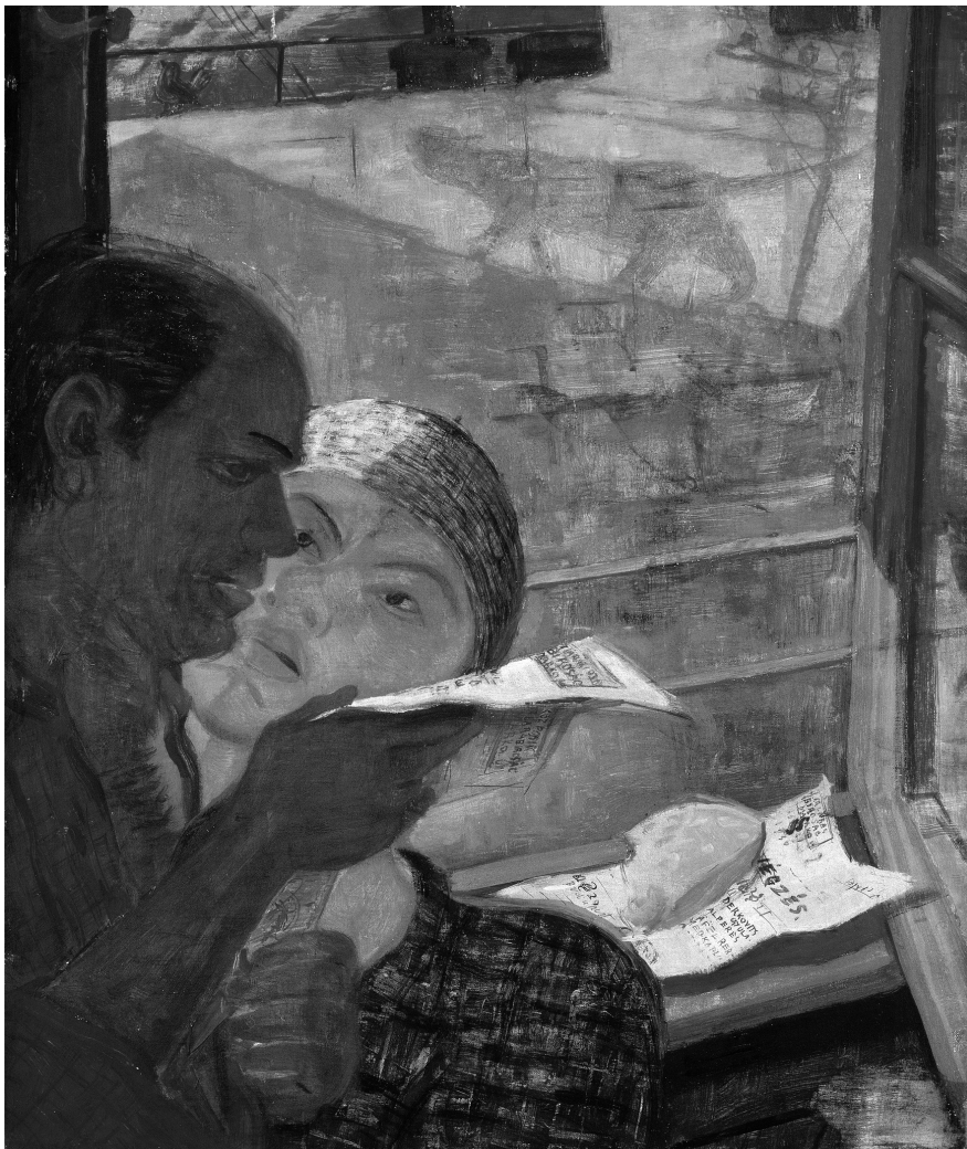
1. Derkovits Gyula: Végzés, 1930. Tempera, vászon, 61 x 51 cm. MNG, ltsz.: 57.48 T. © Szépművészeti Múzeum – Magyar Nemzeti Galéria

jól ismert makacsságával reagált: „Ha kép nem kell, hát álljon a harc” – olvashatjuk első reflexióját a Mi ketten lapjain. A nincstelen festő és a könyörtelen háztulajdonos konfliktusáról kialakuló egyszerű képet alaposan árnyalja mindaz, ami a kor egyik legjelentősebb műgyűjtője, Fruchter Lajos 1941-ben született visszaemlékezéséből kiderül. Szavai szerint először 1930 áprilisának végén vagy a következő hónap elején kereste fel Derkovitsot. 5 Azon túl, hogy több képet is vásárolt tőle, egy ideig