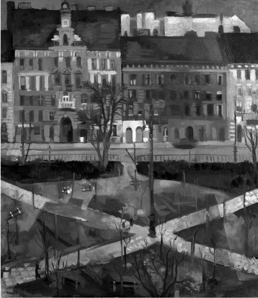
2. Duray Tibor: A Hunyadi tér télen, 1937. Magántulajdon. A Derkovits művészetéért rajongó Duray Tibor 1937-ben több alkalommal lefestette lakása ablakából a Hunyadi tér szemközti oldalát, a karcsú oromzattal dekorált, 10-es számú bérházzal, melynek 4. emeleti, udvarra néző ablaka előtt a Végzés jelenete játszódik.

evő című képet is felvonultató műcsarnoki kiállítás bezárt. Ez a tárlat az 1930-as „Tavaszi kiállítás” volt, mely április 13-ig tartott nyitva. Fruchter Lajos: Művészek és műalkotások között . [1941]. – Közreadva: Bodnár Éva: A magyar műgyűjtés történetéből. Fruchter Lajos gyűjteménye. Művészettörténeti tanulmányok. A Magyar Művészettörténeti Munkaközösség Évkönyve , 1953. Budapest, 1954. 638–655. – az említett rész: 642.